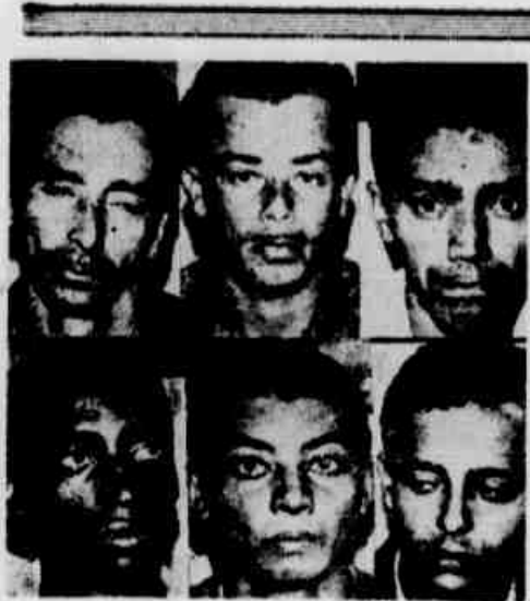
Estes "mentiros" estavam de "maquinhas" em cima, mas tiveram que entregá-las ao doutor