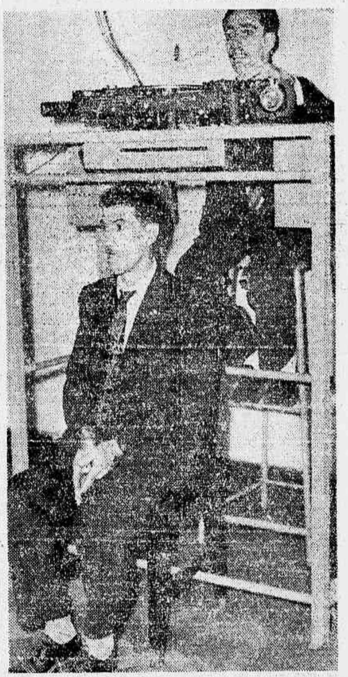
Este é um dos aparelhos do exame psicotécnico. Projeta dois pontos luminosos sobre uma escala unidimensional e movimento ambos com velocidade variável, em sentido oposto. O examinando, calculando mentalmente a velocidade de um ou de outro terá que dizer sobre qual dos pontos de partida se deu o cruzamento dos dois pontos. (Texto na página 7, coluna 4)