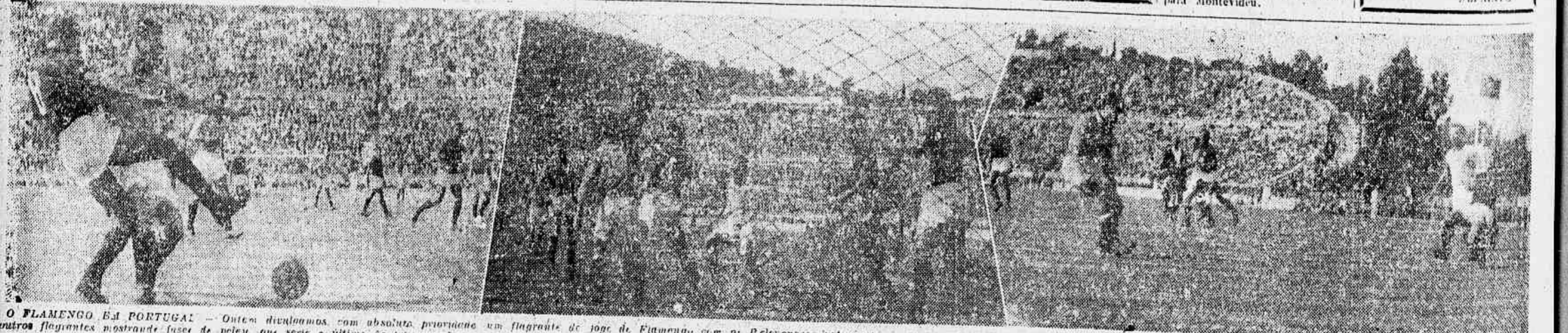
O FLAMENGO EM PORTUGAL — Outros divulgação, com absoluta prioridade em fragmento de jogo de Flamengo com os Belenenses justamente curitiba que finalizada a conquista do prêmio de ouro da competição de futebol. Nota: jogadores, como em apresentação, outros jogadores mostrando fase de peleja que seria o último de tri-campeão, em uma brilhante atuação pela Europa onde realizou dos pacíficos, conservando o honroso título de invicto, sem haver conhecido um empate, sequer, nos seus adversários.

A ENTREGA DAS FICHAS E NÚMEROS TERÁ INÍCIO AMANHÃ, QUINTA-FEIRA, NA PORTARIA DE "A NOITE"