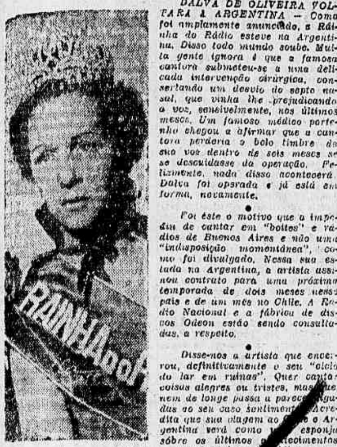
DALVA DE OLIVEIRA VOLTA A ARGENTINA — Como foi amplamente anunciado, a Rádio do Rio de Janeiro, em sua programação especial, dedica-se a trazer para os ouvintes a voz da famosa cantora sul-americana. Dalva foi operada na "Bainha de Rádio".