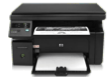
Принтеры и МФУ