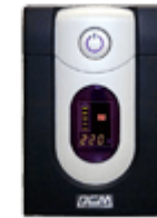
Источники бесперебойного питания