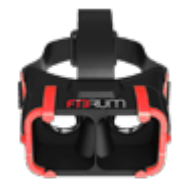
Очки и шлемы виртуальной реальности