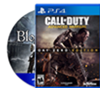
Игры для консолей и ПК