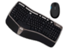
Клавиатуры и комплекты