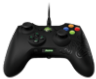
Геймпады, джойстики, рули