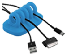
Органайзеры для кабелей