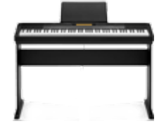
Синтезаторы и цифровые пианино