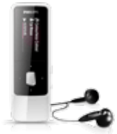
Плееры MP3 и мультимедиа