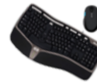
Клавиатуры и комплекты