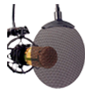
Аксессуары к микрофонам