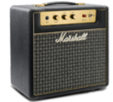
Гитарные усилители и комбо