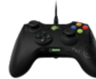
Геймпады, джойстики, рули