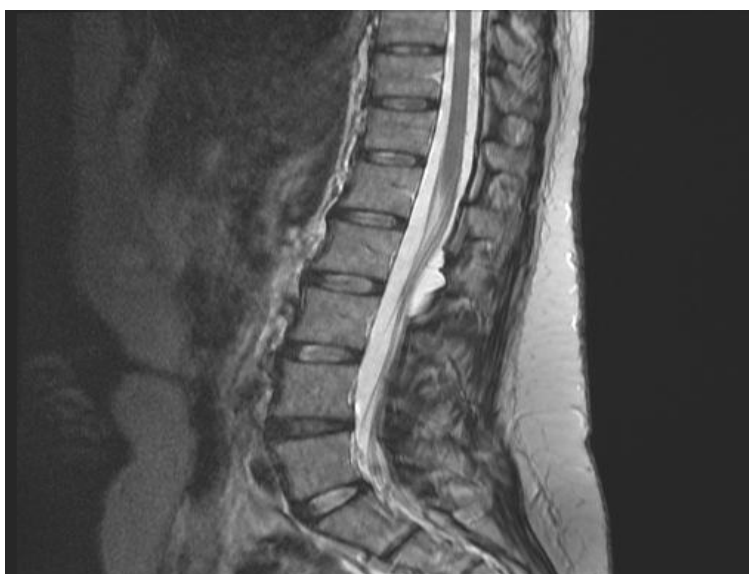
Fig.2 RMN lombo-sacral a coloanei vertebrale în incidentă sagitală, Chist Tarlov la nivel L2-L3;

Analiza corelativă a manifestărilor clinice și modificărilor imagistice a evidențiat dependența severității sindroamelor neurologice de dimensiunile chisturilor perineurale.