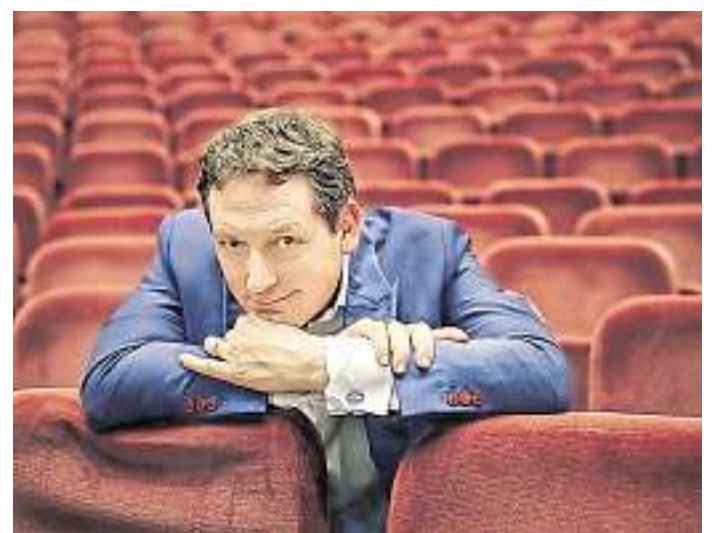
Eckart von Hirschhausen bittet am 22. Januar in der Saarländhalle zur Sprechstunde.

Gewinner werden benachrichtigt Die Teilnahme am Gewinnspiel ist ab 18 Jahren möglich. Die Gewinner werden benachrichtigt und unter www.WochenspiegelOnline.de veröffentlicht. Der Rechtsweg ist ausgeschlossen. red./jb