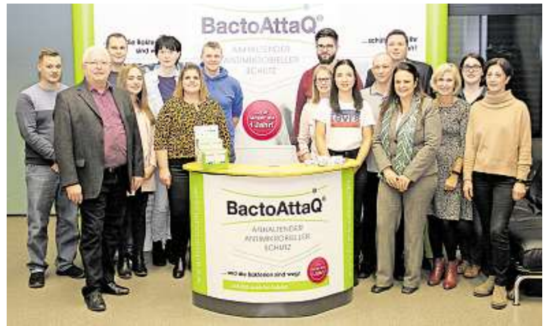
Das Mitarbeiterteam der Firma C.P.S. Pharma in Beckingen.

DÜREN Das Fallschirmjägerregiment 26 führt von Dienstag bis Mittwoch, 14. bis 16. Januar, mit 250 Soldaten, zehn Radfahrzeugen und einem Flugzeug, im Raum Düren eine Fallschirmübung mit Außenlandungen durch. Starts und Landungen des Flugzeugs erfolgen vom Flugplatz Düren aus. red./am