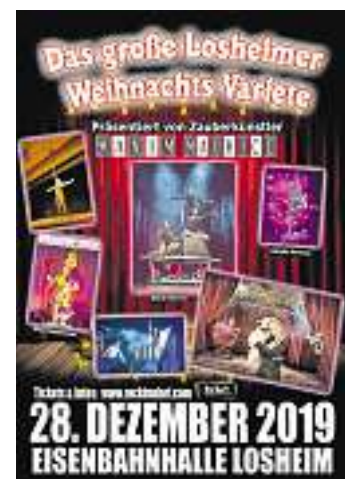
Die große Weihnachtsvarieté 2019.

Opernarien schmettert: Sabine Murza alias „Murzarella“ lässt ihre Puppen nicht tanzen, sondern: singen. Und das in drei verschiedenen Stimmen und auf exzellentem Niveau. Mit der Geschwindigkeit einer