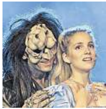
„Die Schöne und das Biest“.

SAARBRÜCKEN Als sich am 3. September 1994 im Kölner Satory-Saal der Vorhang hebt für die erste Bühnenszenierung der berühmten französischen Novelle „La Belle et la Bête“ erlebt ein staunendes deutschsprachiges Publikum die Welturaufführung eines der romantischsten Musicals aller Zeiten. Seit damals fiebern Millionen mit der mutigen, jungen Bella mit, lachen über die Einfältigkeit einer bäuerlichen Dorfgemeinschaft und fürchten und bemitleiden gleichermaßen das schreckliche Biest, das erst durch die Liebe der beherzten Maid zu einem schön-