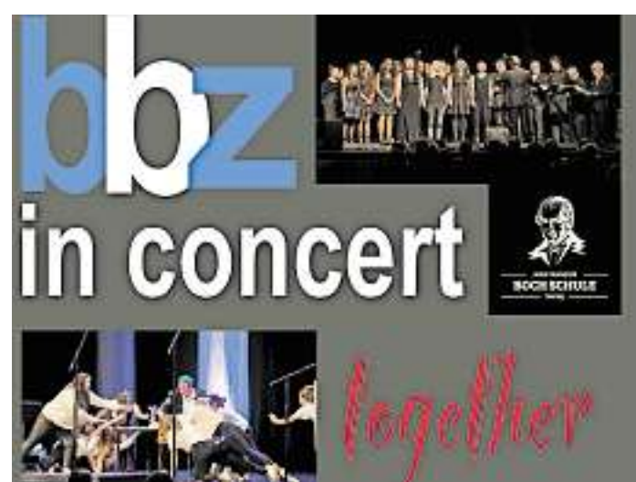
Das Konzert steht unter dem Motto „Together“.