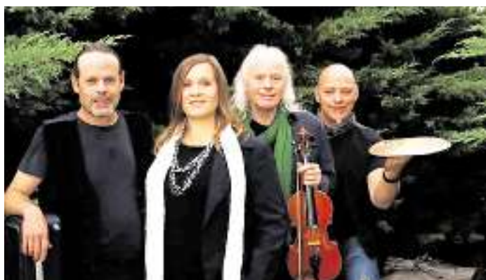
Die Band „Miss K and the Unables“ ist im Glashaus Saarschleife bereits bekannt.