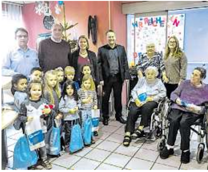
Die Kinder der Katholischen Kindertageseinrichtung St. Johann haben die Bewohner des Willi-Graf-Hauses besucht und ihnen Basteleien mitgebracht.

SAARBRÜCKEN Pünktlich zum Start in die Vorweihnachtszeit besuchen auch die Kinder der Katholischen Kindertageseinrichtung St. Johann das Willi-Graf-Haus (Stiftung Langwied). „Ein Moment fürs Herz, der für Jung und Alt aus vielen Gründen sehr wertvoll ist“ finden alle Beteiligten übereinstimmend.