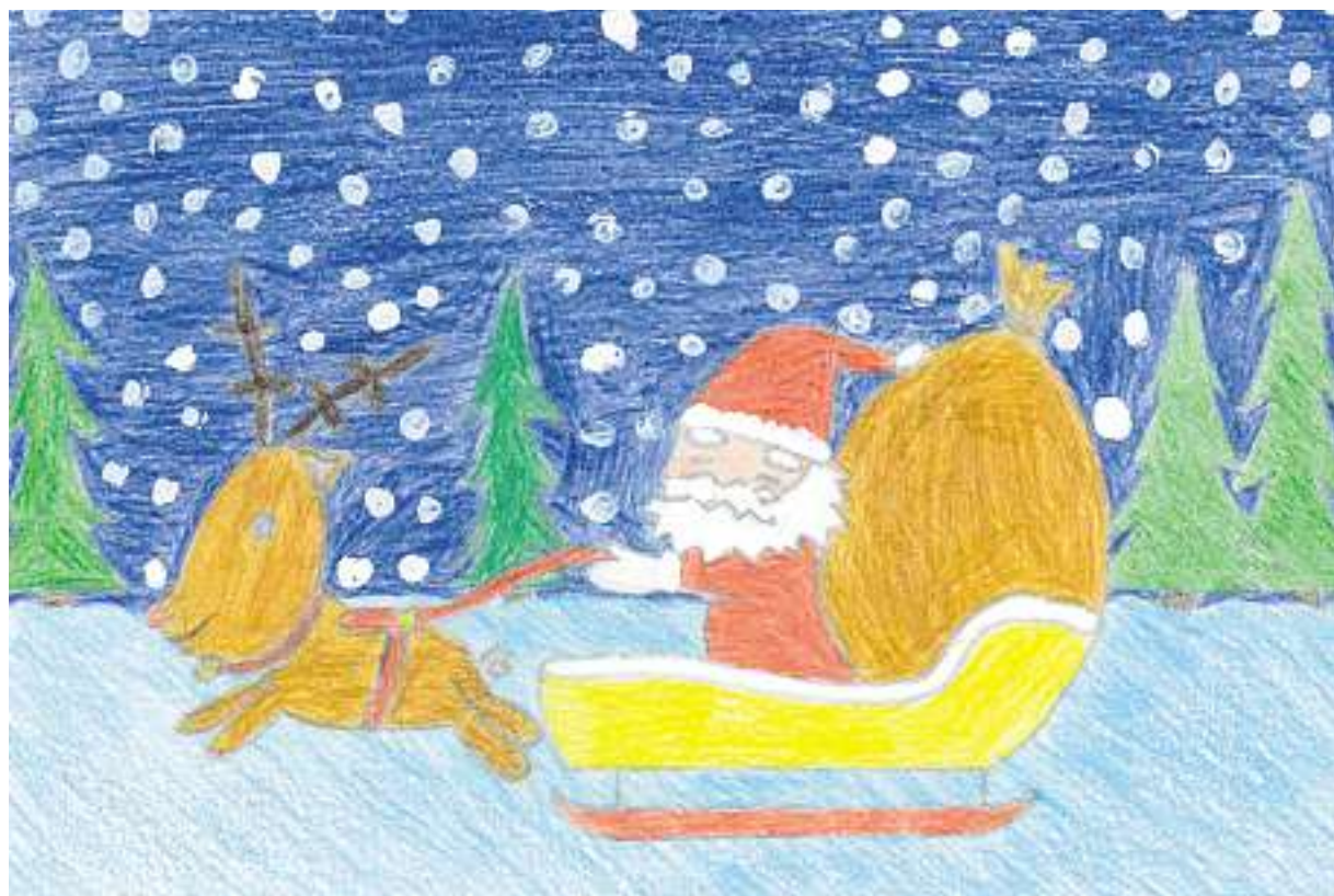
Wir grüßen unsere Leserinnen und Leser mit einem Weihnachtsmotiv, gestaltet von Joshua Lehnert aus der 6c des Hochwald-Gymnasiums Wadern.