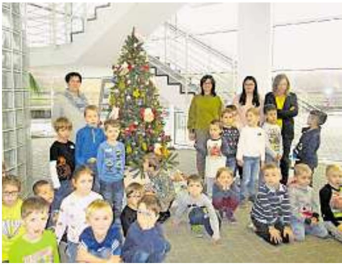
Die Warndtwichtel brachten den selbstgebastelten Schmuck mit und schmückten den Weihnachtsbaum bei der AVA Velsen.