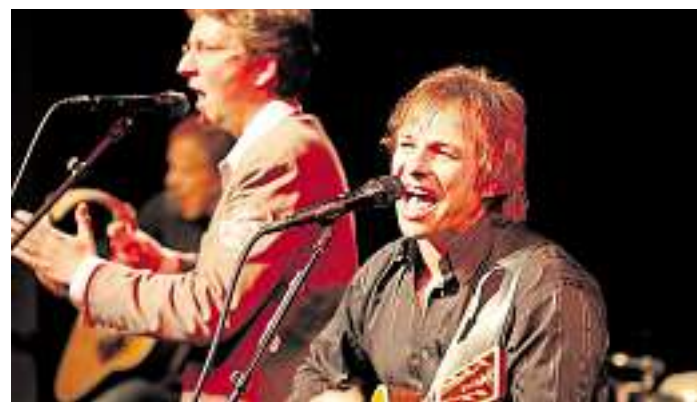
Die Simon & Garfunkel Revival Band lässt die unvergleichlichen Hits wieder lebendig werden.