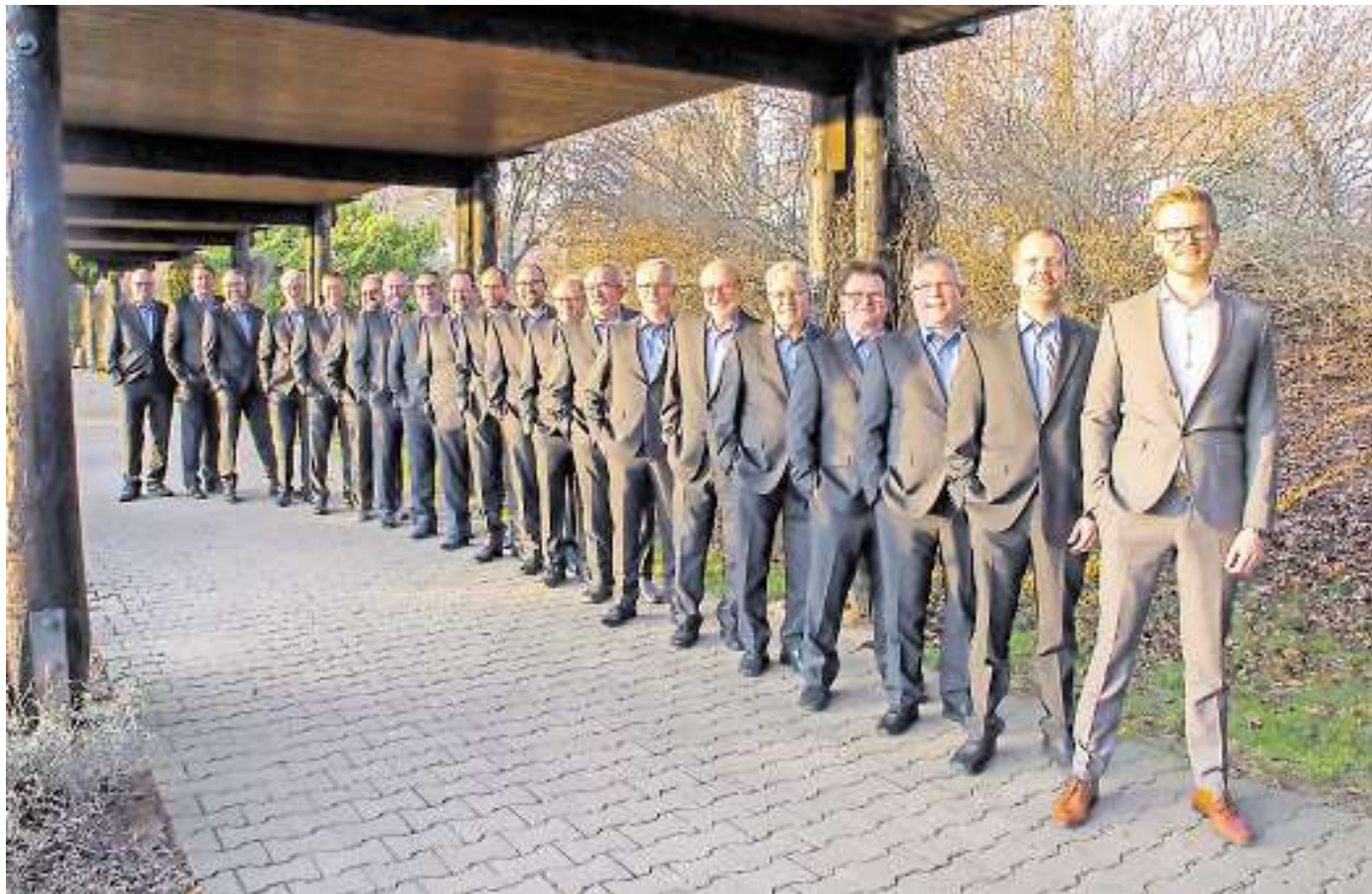
Das „Ensemble 85“ präsentiert auf seiner Tour unter dem Motto „Noël nouvelet“ traditionelle Weihnachtslieder.

Haus Sägemühle und Haus Wald Saarwellingen zu Gast bei der Bundeswehr in Saarlouis