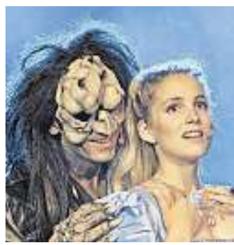
„Die Schöne und das Biest“.

SAARBRÜCKEN Als sich am 3. September 1994 im Kölner Satory-Saal der Vorhang hebt für die erste Bühnenszenierung der berühmten französischen Novelle „La Belle et la Bête“ erlebt ein staunendes deutschsprachiges Publikum die Welturaufführung eines der romantischsten Musicals aller Zeiten. Seit damals fiebern Millionen mit der mutigen, jungen Bella mit, lachen über die Einfältigkeit einer bäuerlichen Dorfgemeinschaft und fürchten und bemitleiden gleichermaßen das schreckliche Biest, das erst durch die Liebe der beherzten Maid zu einem schön-