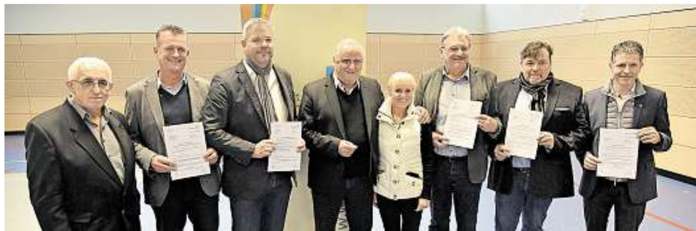
Innenminister Klaus Bouillon unterstützt den Landkreis Merzig-Wadern und sechs kreisangehörige Städte und Gemeinden mit rund 3,3 Millionen Euro Fördermitteln. Foto: Ministerium für Inneres, Bauen und Sport

oder Anleihen in Filmmusik. Aufgelockert werden die Vokal- darbietungen durch instru- mentale Soli mit Flöte und Or- gel. Das Vokalensemble „Ton:art“ lädt alle Musikbe- geisterten zu seinem Weih- nachtskonzert ein. Der Eintritt ist frei. Es wird um eine Spende gebeten. red./am / Foto: Verein