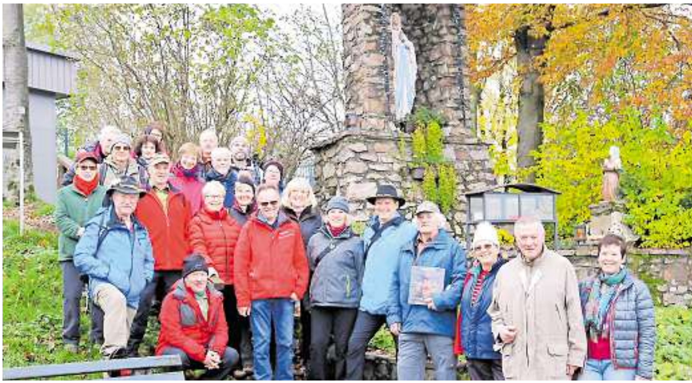
Die Teilnehmer bei der Rast an der Mariengrotte hoch über Tünsdorf.

Für unverlangt eingesandte Manuskripte übernimmt der Verlag keine Gewähr.