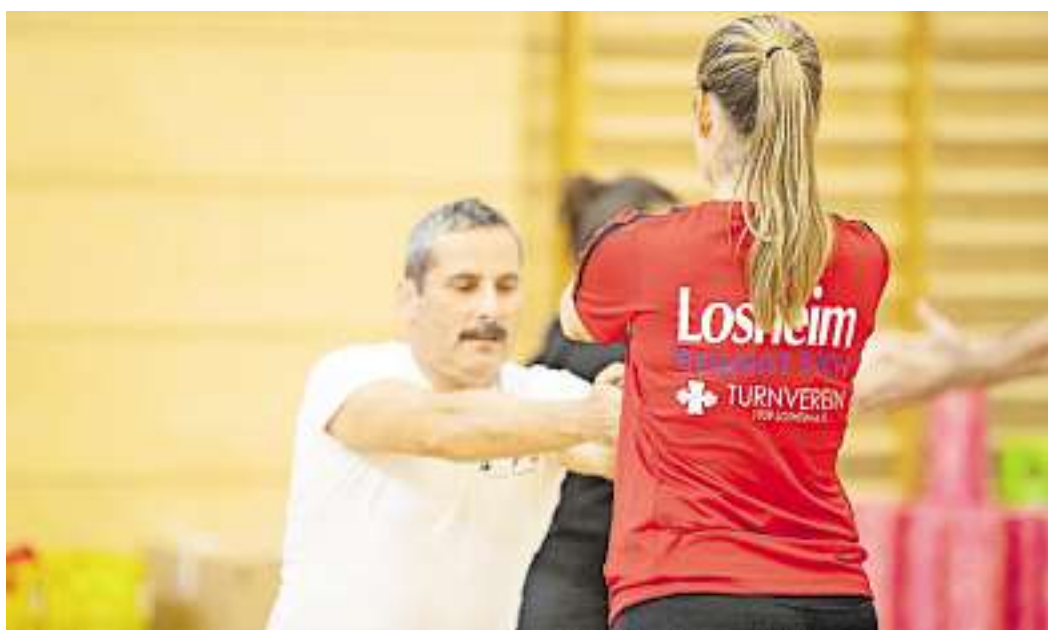
Die neue Broschüre des Bildungswerks Saarländischer Turnerbund enthält zahlreiche Termine.