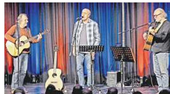
Die Formation „SMS“ gastiert am Dienstag, 21. Januar, um 19 Uhr im Bildungszentrum Kirkel.

Das AK-Bildungszentrum in der Kirkel (BZK) ist von Samstag, dem 21. Dezember, bis einschließlich Sonntag, dem 5. Januar, geschlossen. Auch während der Feiertage besteht natürlich die Möglichkeit, viele wichtige Informationen online unter www.arbeitskammer.de abzurufen oder sich über das Bildungsangebot im BZK zu informieren, unter www.bildungszentrum-kirkel.de. red./jb