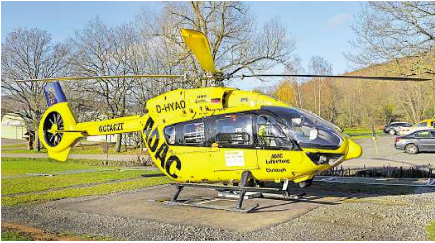
Christoph 66 bietet der Uniklinik Homburg binnen weniger Flugminuten eine schon lange gewünschte, verlässliche Intensivtransportkapazität!