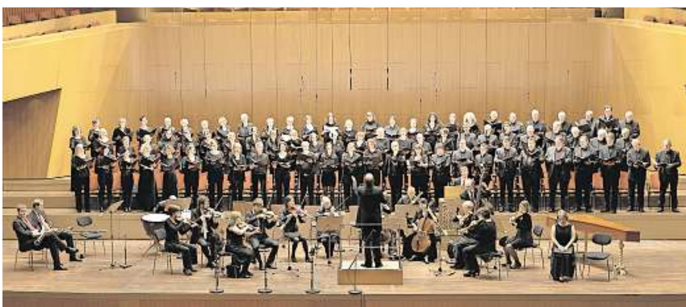
Das Neujahrskonzert findet am 4. Januar um 18 Uhr in der Congresshalle in Saarbrücken statt.

Der Pflegebeauftragte ist über Tel. (06 81) 501-32 97, Telefax (06 81) 501-32 77; sowie per E-Mail (geschaeftsstelle.pflegebeauftragter@soziales.saarland.de) erreichbar. Das Pflege-telefon ist weiterhin unter Tel. (06 81) 5 01 34 80 zu erreichen. eb