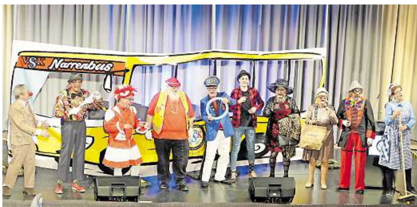
Das Jubiläum 6x11 Jahre Verband Saarländischer Karnevalsvereine wurde prunkvoll gefeiert.