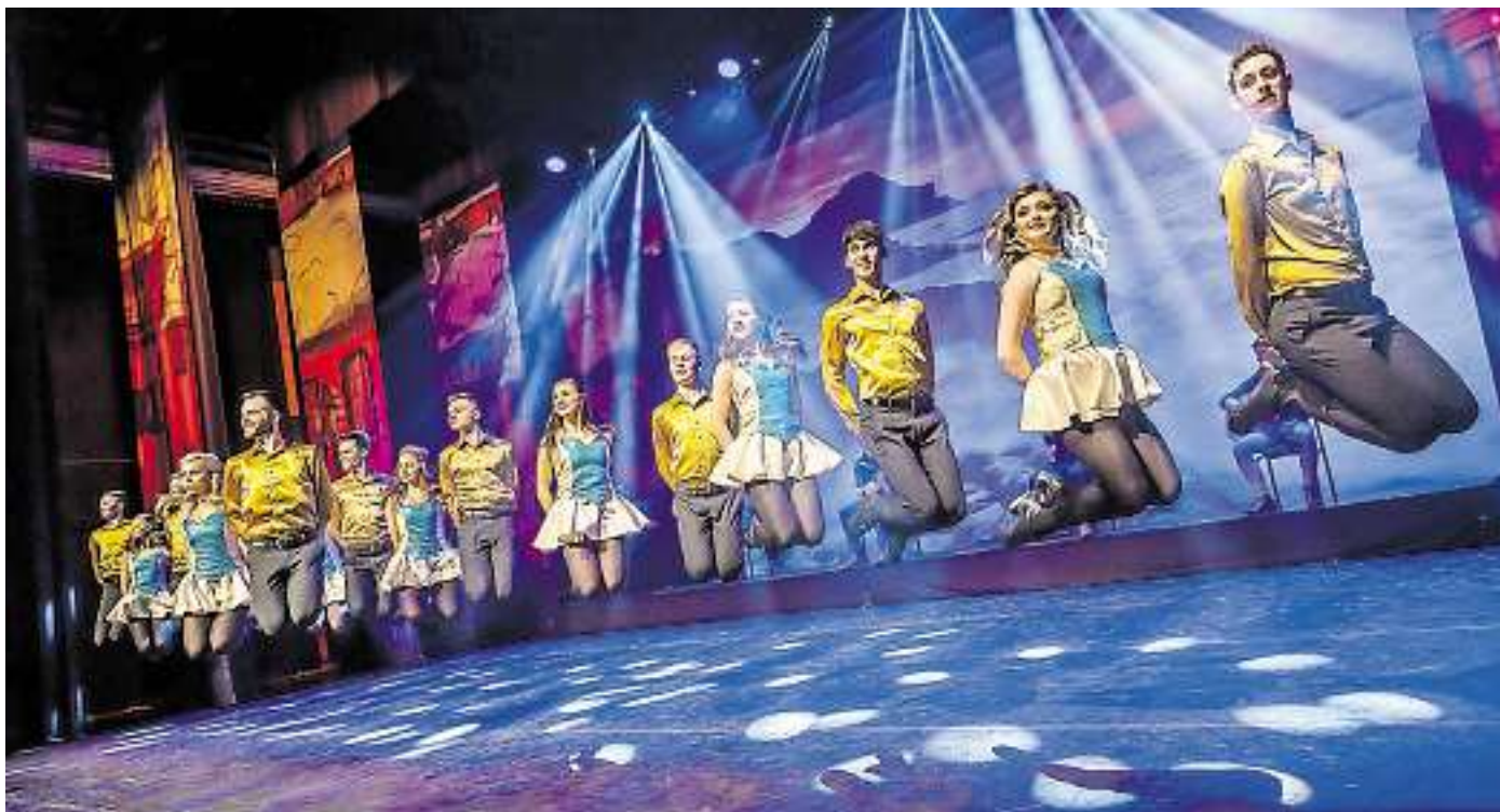
Rhythm of the Dance.

Die Live-Band bestimmt die stimmungsgeladene Lebhaftigkeit der Show mit einer beeindruckenden Bandbreite an teilweise außergewöhnlichen Instrumenten. Die Bandmitglieder beherrschen und präsentieren dabei unter anderem Geigen, Flöten, Ziehharmonikas, Harfe und Banjo sowie die traditionelle Uilleann Pipes (Irischer Dudelsack) und den Bodhran (Irische Rahmentrommel). Karten gibt's in allen bekannten Vorverkaufsstellen. Ticket-Hotline: (06 51) 9 79 07 70; www.kultopolis.com . red./am