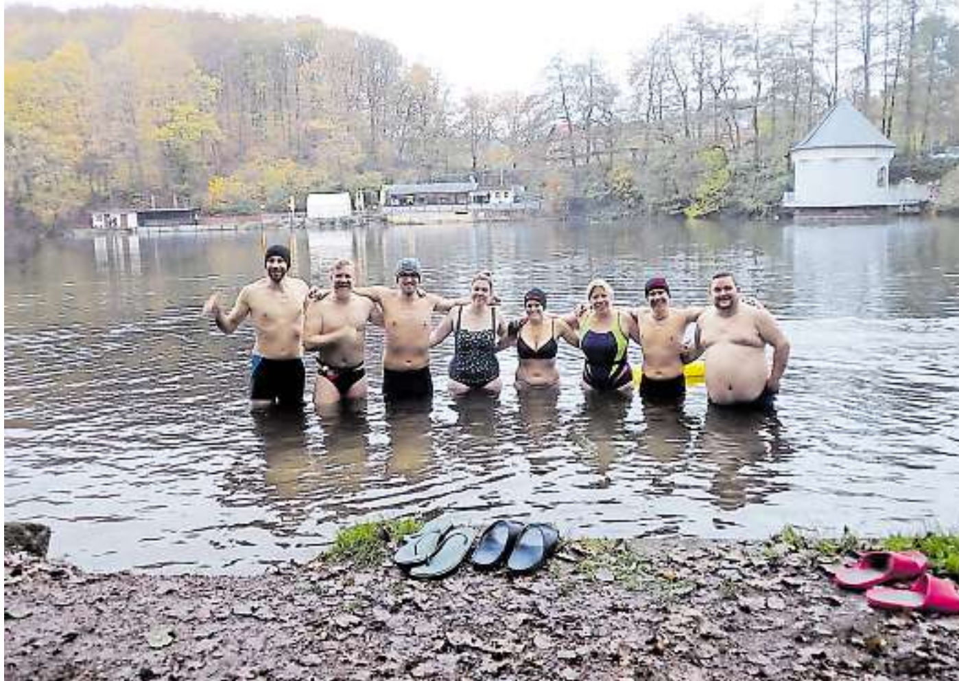
Hart im Nehmen: die Seelöwen und Seelöwinnen haben es eilig am liebsten.

Expertise gemeinsam auf Tour – sagenhafte Sounds der besonders spektakuläre Art stehen bevor. Hits, Hits und nochmal Hits – alle drei Legenden gehen mit eigenen Sets an den Start! Bis jetzt unter Verschluss gehaltene und streng geheime Details werden den berühmten Musikern dabei von keinem Geringeren als Andy Scott von Sweet entlockt. „Music Stories“ ist am 18. Januar in der Saarländhalle zu erleben. Karten für „Music Stories“ gibt es u.a. unter www.WochenspiegelOnline.de/tickets.