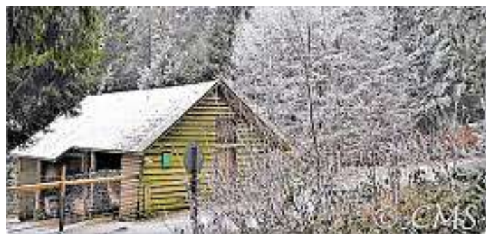
Wanderung mit dem Hund im Wild- und Wanderpark Weiskirchen.

Das Projekt geht auf eine Idee des im Herbst 2016 verstorbenen langjährigen Vorsitzenden und späteren Ehrenvorsitzenden der Union Stiftung, Franz Schlehofer zurück. Die Bücher enthalten einen entsprechenden Hinweis in Form eines Exlibris. red./jb