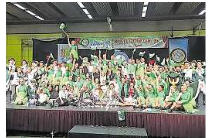
Die Merziger Karnevals-gesellschaft „Humor“ hat bei den Tanz-sport-Saarlandmeisterschaften hervorragend abgeschnitten.

Merziger KG dominiert Tanz-Landesmeisterschaft