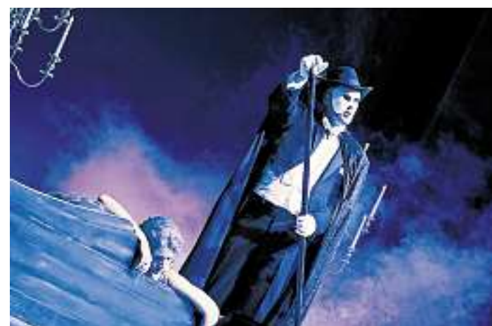
„Das Phantom der Oper“ wird am 29. Januar in der Festhalle in Zweibrücken aufgeführt.