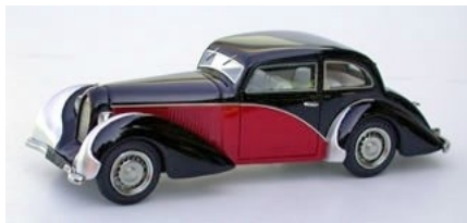
N°99R (rouge / red)

Le modèle reproduit est une berline recarrossée en 1938 par FIGONI & FALASCHI d'un dessin plutôt lourd pour ce carrossier, mais très particulier avec ses imposantes « fresques » chromées sur les ailes avant, sa petite calandre et sa baguette latérale chromée en « V » typique de ce carrossier. Il était fréquent dans les années 1930 de recarrosser une voiture démodée pour la mettre au goût du jour. Il semblerait que cette auto ait disparu.