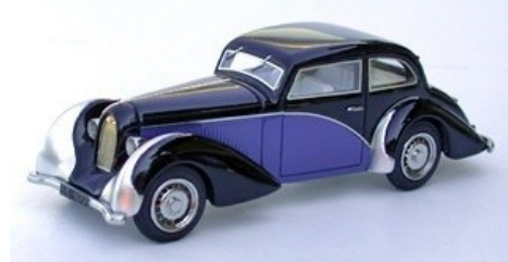
N°99B (bleu / blue)