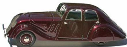
Modèles de pré-série sans insignes