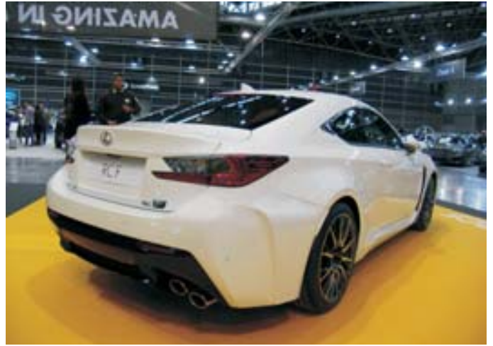
LEXUS. Impresionante este superdeportivo, de la filial de lujo de Toyota, el Lexus RCF.