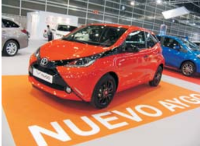
TOYOTA. Mostrados los nuevos modelos Yaris y el pequeño Aygo, con un frontal enmascarado con mucho carácter.