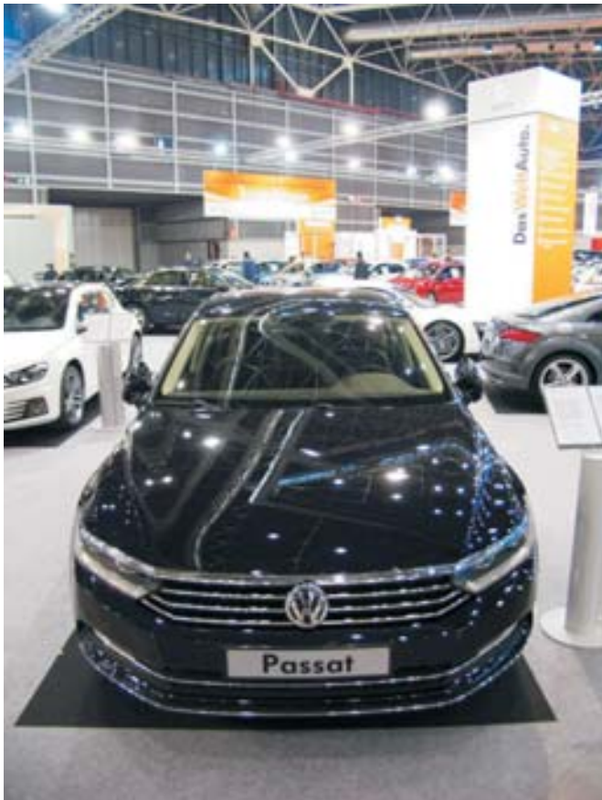
VOLKSWAGEN. Además del esperado Polo GTI, llega el nuevo Passat, en su octava entrega.