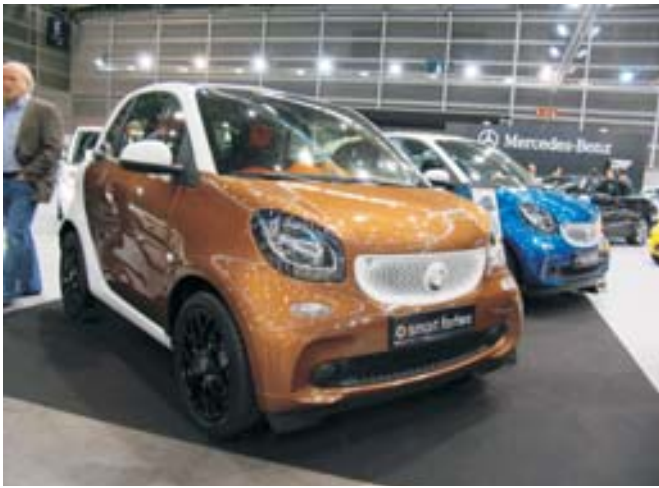
SMART. En el stand de Mercedes, se presentó el nuevo Smart en sus versiones de dos y cuatro puertas.