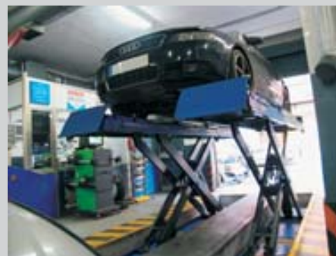
Debajo: Simón, realizando trabajos de mantenimiento en un vehículo.