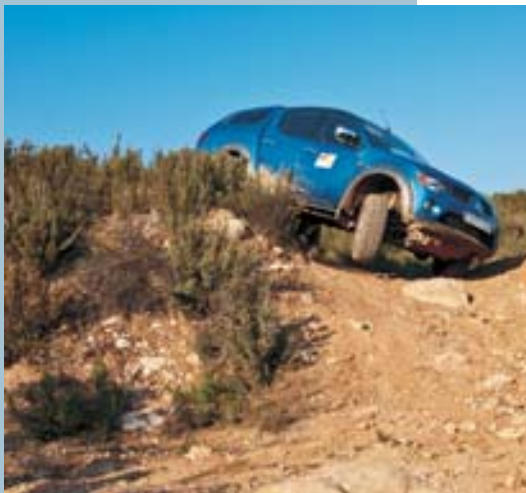
Conducción off-road 4x4