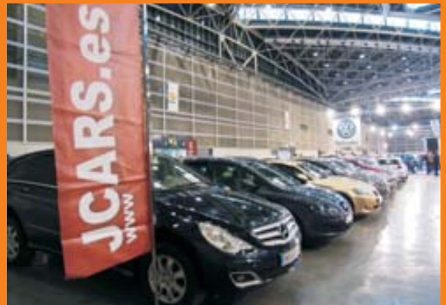
MERCADO DE OCASIÓN. Interesantes ofertas de vehículos de ocasión como los modelos ofrecidos por Leadercar Levante ó JCARS a los visitantes de la Feria.