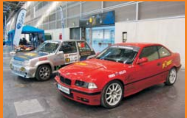
COMPETICIÓN. Los vehículos de competición se pudieron admirar, tanto dentro como en la Competición de Slalom.