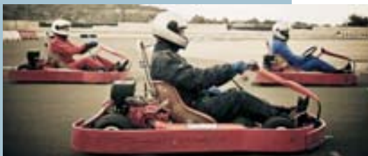
Pilotaje de karts y monoplazas