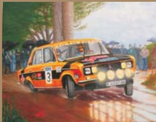
LANCIA STRATOS HF GRUPO 4 DE 1972.

EL COCHE DE RALLYES MÁS EFECTIVO E IMPRESIONANTE DE TODOS LOS TIEMPOS.