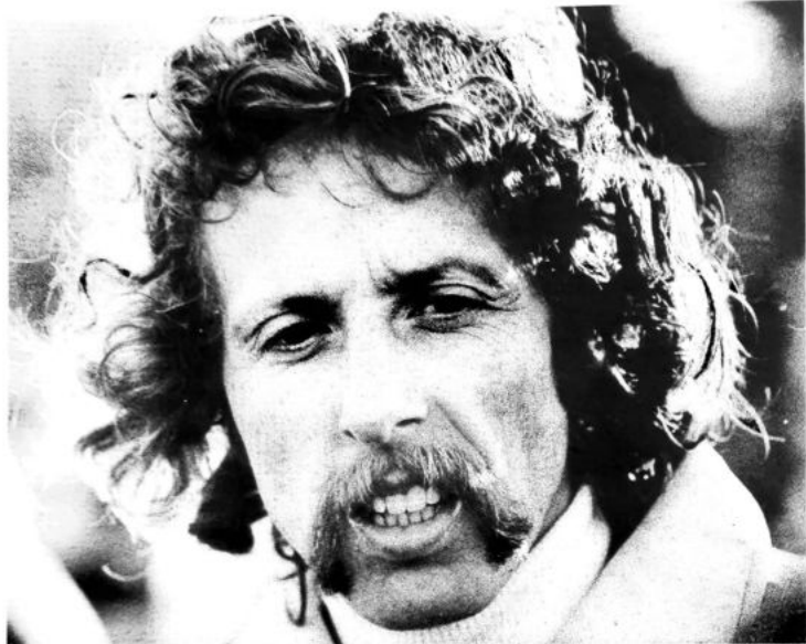
boven: JOS HERMENS , de snelste ter wereld op de 10 EM, de 20 KM en het uur.