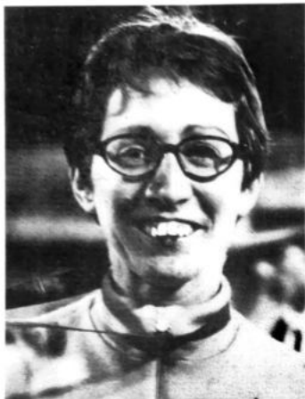
boven links : MARIA GOMMERS, 800 m winnares van de bronzen medaille op de Olympische Spelen van Mexico 1968