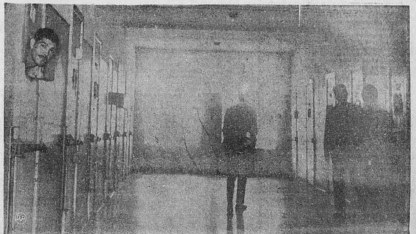
Solitário e enclausurado numa cela, o recluso de Piraquara vê no visitante um meio de comunicação muito amplo com o mundo de fora. Mas como nem todos recebem visitas, é através da correspondência, que manifestam todos os seus problemas, desde sua vida mais íntima, até os de menor importância, como conta a reportagem de hoje do DP ESPECIAL, (Pág. 6 do 1.º caderno).