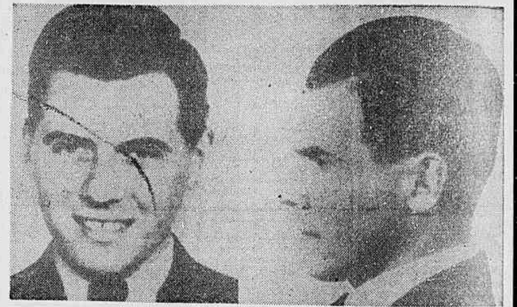
Estas são duas das poucas fotos que as autoridades paranaenses dispõem para dar cara ao carrasco nazista Josef Mengele. Os retratos são antigos e Mengele estaria usando barba escura para disfarçar.