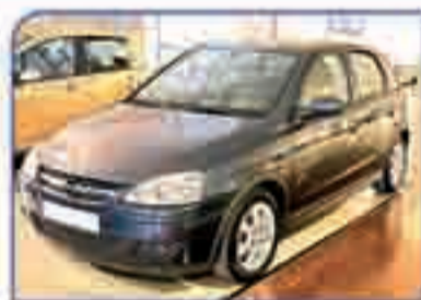
OPEL CORSA 1.3 CDTI Silverline 2006. DA/CC/EE/AA/CO. Llantas. 9.900 €.