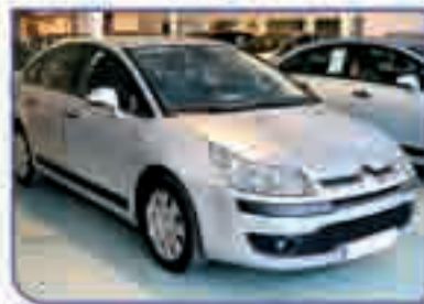
CITROËN C4 1.6 HDI SX 2005. Como nuevo. 13.900 €.