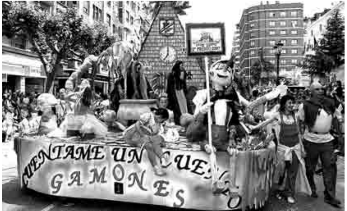
'Cuéntame un cuento', carroza de la peña Los Gamones, obtuvo el segundo premio en el desfile de fiestas.

El jurado también premió 'Fantasía cidiana', del Club Victoria Nido, con un accesit de 1.000 euros y entregó tres menciones de 600 euros a las propuestas del