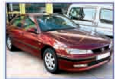
PEUGEOT 406 2.0 SYDT HDI 110 DA/CC/EE/CLIM/ORD. Llantas. 7.800 €.