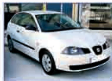
SEAT IBIZA SDI Stella 2004. Pocos kilómetros. Libro mantenimiento. 7.900 €.