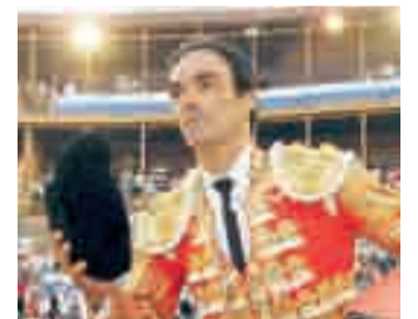
El Cid tiene su público en Burgos.

El cartel del jueves día 28 lo forman José Ignacio Ramos, José Tomás y Manuel Jesús 'El Cid'. Esperada corrida, que unida a del día de San Pedro, con Enrique Ponce, Sebastián Castella y 'Morenito de Aranda' son de lujo. La feria se cerrará el sábado 30 con Jesulín de Ubrique, 'El Cordobés' y Francisco Rivera Ordóñez. La feria este año responde. Pág. 10