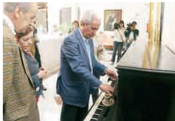
Visita del alcalde al rehabilitado interior del palacio de Castilfalé.

En los trabajos de restauración han participado 16 mujeres de la Escuela Taller de Burgos, cuyo curso se ha dedicado al trabajo y recuperación de la madera y artesonados, así como a la rehabilitación de telas y tapices de muebles nobles y antiguos.