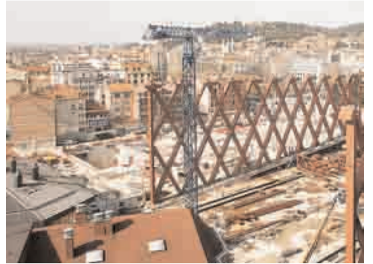
El solar de Caballería acogerá, entre otros edificios, el futuro Auditorio.

Por su parte, el maestro Rafael Frühbeck destacó la importan-