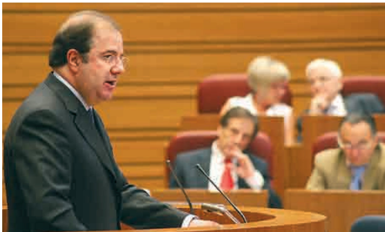
Juan Vicente Herrera en su discurso de investidura de la segunda legislatura "y media" al frente de la Junta.

Herrera abogó por un sistema educativo de calidad que evite que los titulados se marchen