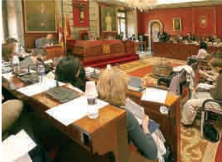
Imagen de uno de los primeros plenos de la nueva corporación local.

Por su parte, el Partido Popular justificó la medida en una mayor agilidad en aquellos asuntos menores, ya que de esta forma ya no tendrán que pasar por el salón de Plenos y recibirán su