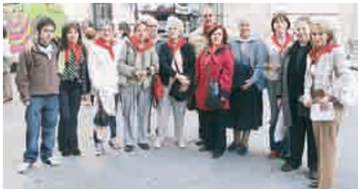
Los burgaleses ausentes visitaron la ciudad en el tren turístico de Burgos.