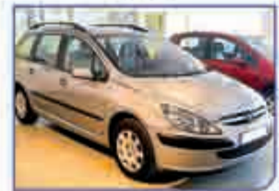
PEUGEOT 307 Break 2.0 HDI XR 2004. Poco kilómetros. 11.900 €.

BU-MOTOR - Ctra. Madrid Irún, Km. 244 - 947 48 22 50 - Burgos