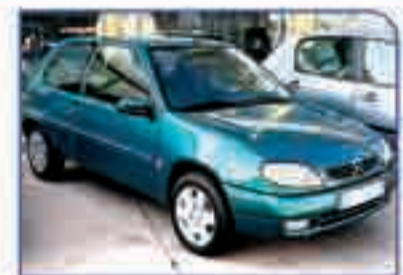
CITROËN SAXO 1.4i SX 2003. DA/CC/EE/AA. Perfecto estado. 5.500 €.