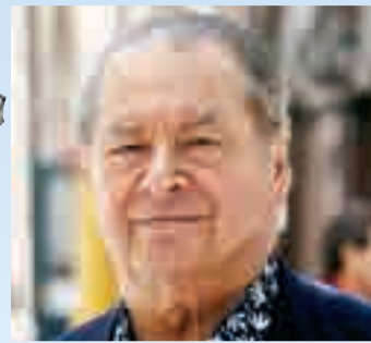
Rafael Frühbeck Director del festival Estío Musical Burgalés

El maestro Frühbeck presentó la VIII edición del Estío Musical Burgalés, que tendrá lugar en septiembre, con un programa que apuesta y conjuga los autores y músicos de la tierra con grandes clásicos de todos los tiempos y una nueva línea de música coral. El director del Estío ha organizado un festival que reorienta su programación dotando a la ciudad de Burgos del trampolín suficiente para que dentro de dos años el Auditorio acoja la X edición y suponga un reconocimiento al edificio y a la programación del mismo.