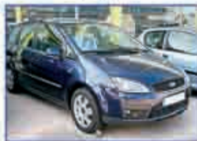
FORD FOCUS C-Max 1.6 Trend. 2005. Libro de mantenimiento. 13.400 €.