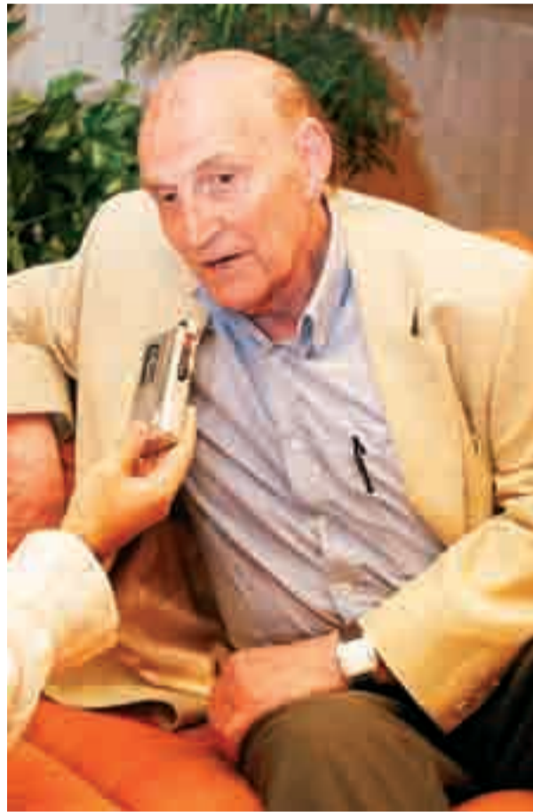
Marcos Ana en un momento de la entrevista en Burgos.

—Sí, que se den por anulados todos los procesos de guerra que se hicieron contra nosotros por tribunales ilegales que nacieron de la sublevación militar del 18 de julio. Es una asignatura pendiente. La viuda de Julián Grimau lo pide siempre. Nuestra tarea es conseguir que se anulen por completo todos los procesos incoados durante la dictadura contra los demócratas españoles. Lo han hecho ya otros países.