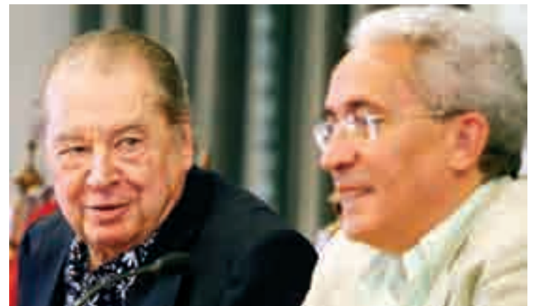
Presentación del VIII Estío con el maestro Rafael Frühbeck (izquierda).

El Estío finaliza con la Orquesta Sinfónica de Burgos, el domingo 23, y "un programa muy popular", destacó el maestro Frühbeck, con música coral de Un americano en París, El aprendiz de Brujo, Mi madre la oca y Bolero.