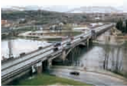
El río Ebro, a su paso por la ciudad de Miranda.

de escasa calidad; que si los fuegos dejan mucho que desear; que si la Feria no está resultando lo que se preveía... En fin, que puestos a criticar, no dejamos títere con cabeza. Encima, va el Burgos CF y no sube a la División de Plata. Tampoco el CD Mirandés , que en la vecina ciudad del Ebro protagonizó el domingo 24 una amarga victoria al ganar al Villarreal por 2-1, pero no servirle de nada el resultado para abandonar la tercera división. ¡Otro año será!, se consolaban ambas aficiones.