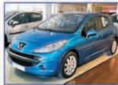
PEUGEOT 207 1.6 HDI XT Pack 110 cv. 2006. Sensor lluvia. Sensor luz. Alto de gama. 16.500 €.