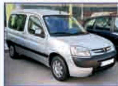
PEUGEOT PARTNER Combispacer 1.9 D. DA/CC/EE/AA. Pocos kilómetros. 9.500 €.