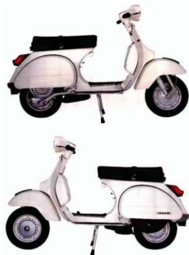
Biancospino MaxMayer 1.298.1715

“VESPA PX del 1977 e 1978 – 125 cc. VNX1T di esemplari prodotti: 197.147; 150 cc. VLX1T esemplari prodotti: 345.301; 200 cc. VSX1T esemplari prodotti 158.999”