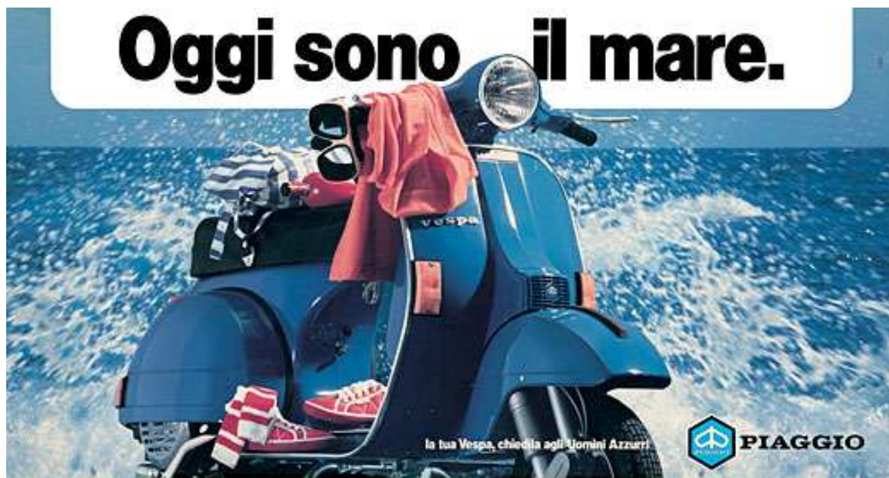
Immagine pubblicitaria