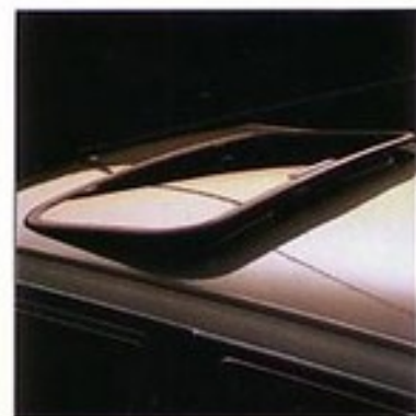
Toit ouvrant en option.