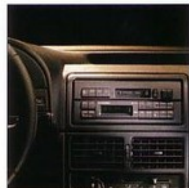
System Audio de série.