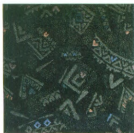
Bekledingsdessin in de LX – TWIST

K ies de kleur die bij u past uit het beschikbare kleurenpalet. De autolakken worden met de grootst mogelijke zorg aangebracht. Met alle aandacht voor het milieu: geen van de lakken bevat zware metalen en de blanke lak heeft een laag gehalte aan oplosmiddelen. De bekleding en sierstrippen zijn gemaakt van slijtvaste materialen. De stof van de bekleding 'ademt' zodat u zich zelfs op de warmste dagen fris blijft voelen. En de vrolijke dessins zorgen voor de finishing touch.