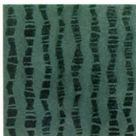
Bekledingsdessin in de GLX – LINEA