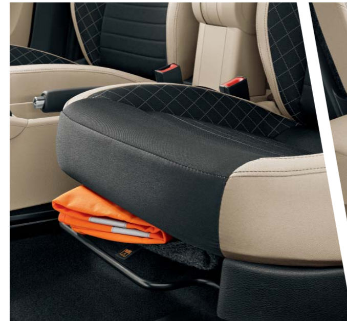
Jeden z mnoha Simply Clever prvků se nachází pod sedadlem řidiče. Najdete tu speciální kapsu na výstražnou vestu, kterou máte v případě potřeby okamžitě k dispozici.