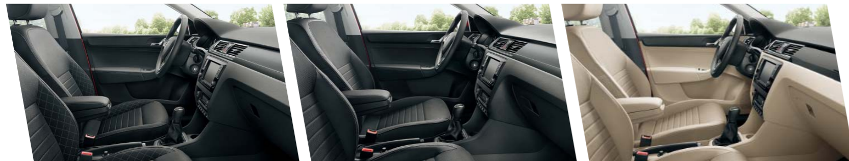
Interiér Style, černý, dekor Dark Brushed

Interiér Dynamic, který nabízí sportovní sedadla a kryty pedálů z ušlechtilé oceli, dá Vašemu vozu jedinečný charakter. Je dodáván jako mimořádná výbava pro verze Ambition a Style.