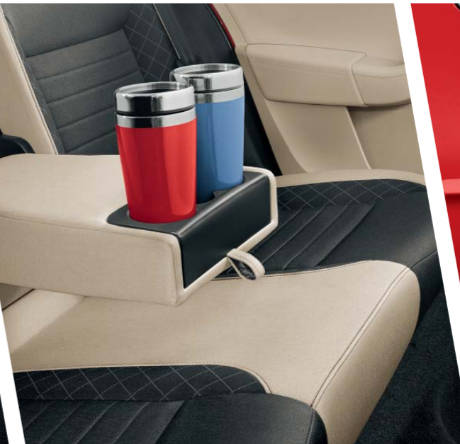
Sklopná loketní opěra vzadu s integrovaným držákem na dva nápoje dává cestujícím na zadních sedadlech možnost užívat si jízdu i občerstvení.