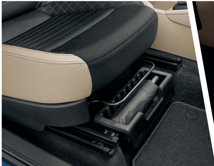
Pod pod pravým předním sedadlem může být umístěna schránka s originálním deštníkem ŠKODA.

Důmyslné detaily či řešení, včetně úložných míst v interiéru, podstatně zvyšují praktičnost vozu. Dokážou totiž jednoduše znásobit jeho přepravní možnosti, pomáhají Vám udržet pořádek a zpříjemňují celé posádce cestování.