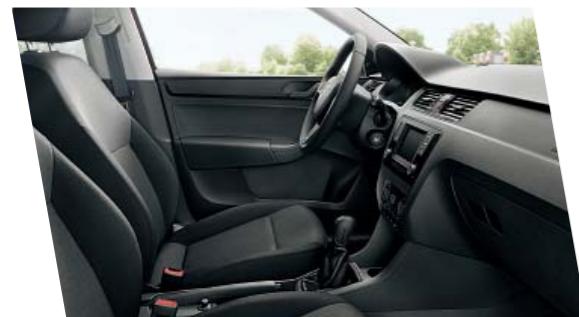
Interiér Active, černý

Verze Active nabízí černé dekorativní prvky jako klíčky dveří, rámečky ventilace a rámečky přístrojů ve sdruženém panelu. Základní výbava zahrnuje například elektrické ovládání oken vpředu a výškově nastavitelná přední sedadla.