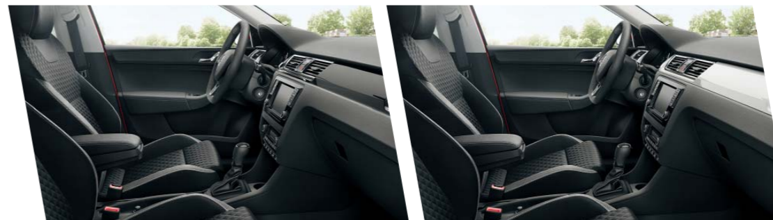
Interiér Dynamic, dekor Piano Black