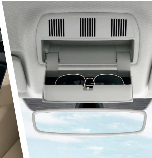
Schránku na brýle umístěnou nad zpětným zrcátkem uvítají zejména řidiči, kteří si před jízdou mění sluneční brýle za dioptrické.