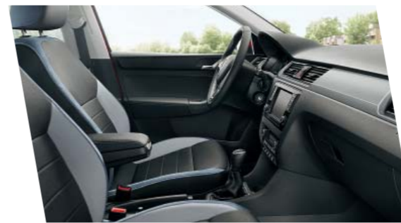
Interiér Ambition, modrý, dekor Silver Brushed

Verze Ambition nabízí černé dekorativní prvky jako klíčky dveří, rámečky ventilace, rámečky přístrojů ve sdruženém panelu a detaily na volantu. Ovladače topení a kroužek na řadicí páce jsou chromované. Základní výbava zahrnuje například loketní opěru vpředu, schránku na brýle a centrální zamykání s dálkovým ovládním.