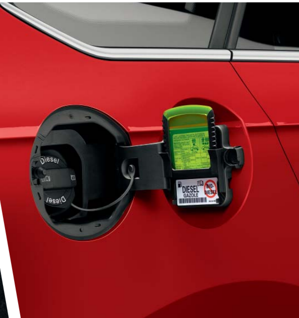
Škrabka na led umístěná na krytu palivové nádrže bude ve chvíli, kdy ji potřebujete, po ruce. A navíc nevádí, že ji sem odkládáte mokrou.