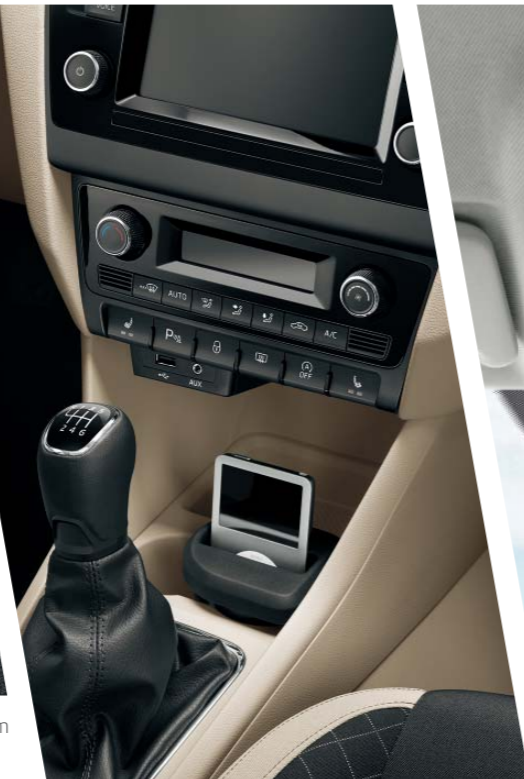
K bezpečnému převážení externích přístrojů je určen držák na multimediální přístroje, který lze umístit do dvojitého držáku nápojů ve středové konzole.