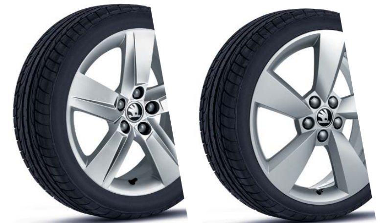
16" kola z lehké slitiny Rock.

Přední a zadní lemy blatníků a kryty prahů ve strukturované černo-šedé barvě umocňují jedinečnost verze ScoutLine a její outdoorový charakter.