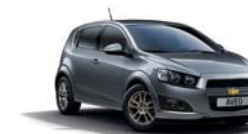
SATIN STEEL GREY METALLISEE