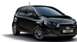
CARBON FLASH METALLISEE