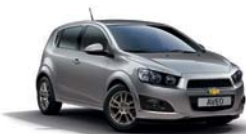
ICE SILVER METALLISEE