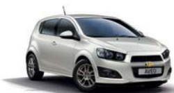
SNOWFLAKE WHITE PEARL METALLISEE