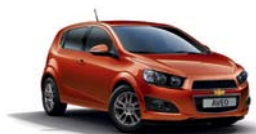
ORANGE ROCK METALLISEE