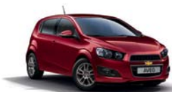
VELVET RED METALLISEE