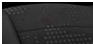
LS, LS+ : Sellerie tissu