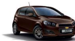
DEEP ESPRESSO BROWN METALLISEE