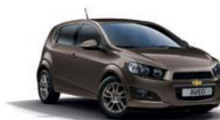
SANDY BEACH BROWN METALLISEE