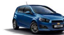
BORACAY BLUE METALLISEE