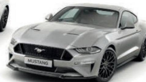
Plata Perla Color metalizado*