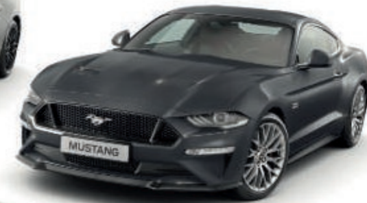
Gris Magnético Color metalizado*