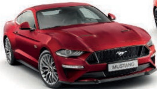
Rojo Rubí Color metalizado*