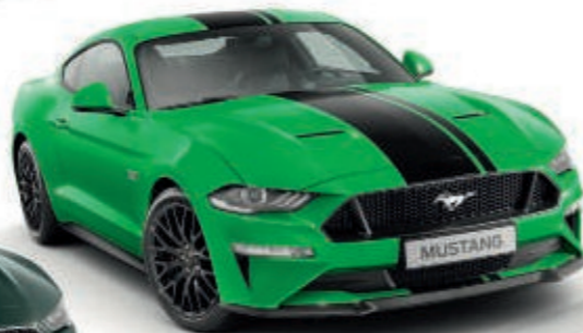
Need for Green oo Color sólido