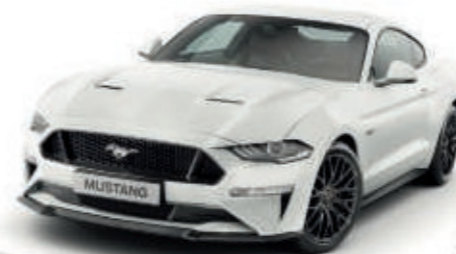
Blanco Oxford Color sólido