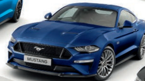
Kona Blue Color metalizado*