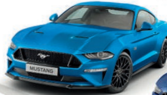
Velocity Blue Color metalizado*