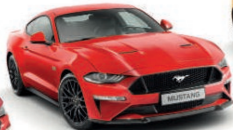
Rojo Race Color sólido