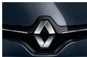
BLEU MARINE FUME