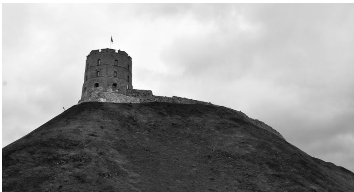
De Gediminastoren in Vilnius