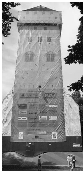
De donjon op doek

Eén van de meest baanbrekende postkoloniale boeken uit de jaren '70 is Edward Saïd's Oriëntalism . In dit boek beschrijft de Palestijns-Amerikaanse wetenschapper hoe de Europese cultuur al jaren op een systematische, disciplinerende manier het oosten beheerst. Hij stelde onder andere dat Europese reizigers de Oriënt stereotypeerden om zo hun eigen Europese identiteit af te bakenen, maar vooral om de Westerse overheersing te legitimeren. Het boek was al een strijd op zich: veel westerlingen voelden zich aangevallen door de kritische blik van Saïd. Zijn werk heeft nog steeds grote invloed op de wetenschappelijke wereld, maar heeft ook veel kritiek te verduren gekregen. Zijn focus op literaire bronnen en de grote tijdsperiode die zijn boek omspant vormen een zwak punt. Over het algemeen wordt de these van Saïd door veel historici geaccepteerd, zij het met de nodige nuances.