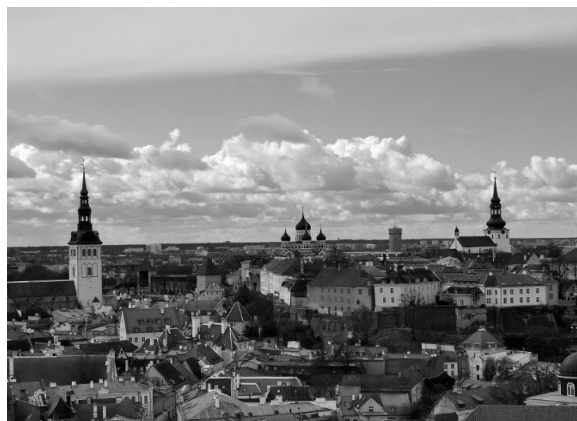
Zicht op Tallinn