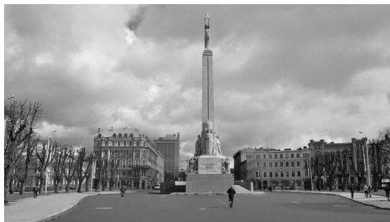
De Vrijheidsboulevard in Riga

Die ochtend kregen we eerst een lezing van de Nederlandse ambassadeur in Riga, in zijn residentie. Na een stevige wandeling van ruim dertig minuten kwamen we aan bij het pittoreske optrekje van de ambassadeur, waar we hartelijk werden ontvangen. Nadat er gezamenlijk geproost was op de verjaardag van de Koning, ving de ambassadeur aan met zijn verhaal. Voor de één erg interessant, voor de ander een goed moment om nog snel een uiltje te knappen. Na afloop van het bezoek aan de ambassadeur hadden we, zoals gezegd, de rest van de dag vrij. Een kleine groep besteedde deze vrije tijd in een oude bunker, waar ze naar hartenlust konden schieten met allerhande wapens. Anderen besloten het centrum van Riga nader te gaan verkennen of met de trein naar een lokale badplaats te vertrekken. 's Avonds verschilde het avondprogramma van de deelnemers sterk: een select gezelschap besloot tezamen met de docenten naar een voorstelling van 'Carmen' te gaan in het Operahuis, terwijl anderen besloten de nachtclubs van Riga aan te doen. Maar niet voordat we allemaal braaf onze tassen ingepakt hadden, want de dag erna stond de volgende busreis op de planning.