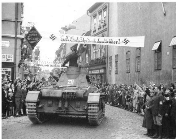
Etnische Duitsers verwelkomden de Wehrmacht

Na de Tweede Wereldoorlog is er vooral aandacht geweest voor de slachtoffers van de 'overwinnaars', maar we moeten niet vergeten dat er ook veel onschuldige burgerslachtoffers zijn gemaakt onder de Duitsers. Vandaag de dag is de uitzetting van de Duitsers een zwarte bladzijde in de Tsjechische geschiedenis die in West-Europa tamelijk onbekend is gebleven. Tegenwoordig wordt het totale aantal Sudeten-Duitsers en Duitstaligen die slachtoffer is geworden van deze praktijken geschat op 275.000.