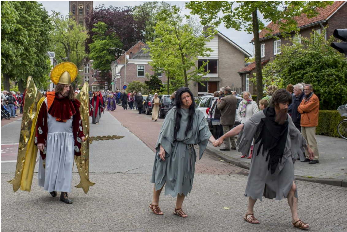
Paradijsgroep met Adam en Eva

In 1949 en 1952 werd een door Harrie Beex geschreven H. Bloedspel opgevoerd. In 1974 werd de band met Hoogstraten strakker aangehaald: voortaan zouden afvaardigingen van beide omgangen aan elkaars processie deelnemen. In 1980 werd het zesde eeuwfeest van het Bloedwonder gevierd, de processie telde ongeveer 500 deelnemers. In de jaren negentig heeft de H. Bloedprocessie op Drievuldigheidszondag onder invloed van de secularisering steeds meer een folkloristisch karakter gekregen met ongeveer 10.000 toeschouwers. Hoewel het religieuze aspect sterk aan kracht heeft ingeboet, is het geen probleem om (jonge) deelnemers te werven vanwege het gezelligheidsaspect en de waardering voor deze traditie.