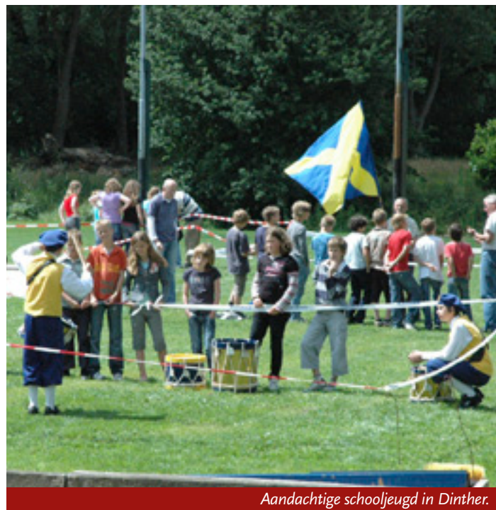
Aandachtige schooljeugd in Dinther.

Zoals al jaren het geval is ontving het Sint Barbaragilde Dinther veertig jongeren van groep zeven uit het basisonderwijs, dit in het kader van het cultuur- en geschiedenisonderwijs. Uit het lespakket "doar hedde de guld", destijds door de federatie in het leven geroepen, is dit pakket een welkome informatie voor de jeugd van de basisschool. Op zo'n middag krijgen ze uitleg over het wel en wee van de schuttersgilden, wanneer er geschoten wordt om de gildekoning, de loting voor de schietvolgorde en de rechten en plichten van de gildekoning. Ook wordt verteld hoe de zilvervesten tot stand komen en wie deze zilvervesten mogen dragen. De tamboers en vendeliers geven demonstraties met tekst en uitleg over hoe deze gebruiken uit de historie zijn doorgegroeid naar de situatie van vandaag.