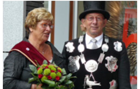
Het nieuwe koningspaar van Sint Joris Goirle.

Hier werd door de aftredende koning het koningsvest aan de schutsboom gehangen om aan te geven dat de functie vacant was. Vele schutters, jong en oud deden hun best de koningsvogel te