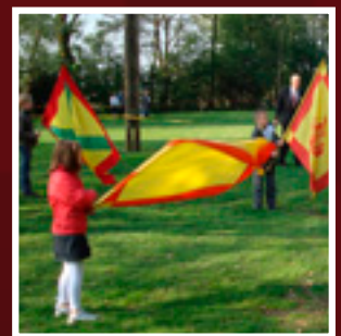
Jeugd maakt kennis met 'de guld'