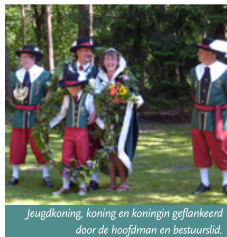
Jeugdkoning, koning en koningin geflankeerd door de hoofdman en bestuurslid.

De nieuwe koning wordt de handen gewassen en hem wordt het koningszilver omgehangen. De koningin krijgt haar koninginnemantel om. De koning heeft de eer om één keer over het vaandel te lopen en om de vendelgroet samen met zijn koningin in ontvangst te nemen. ■