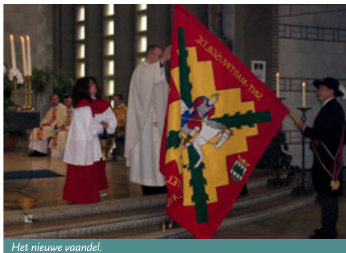
Het nieuwe vaandel.