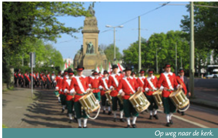
Op weg naar de kerk.

Op zondag 19 april 2009 heeft het Vessemse Sint Lambertusgilde de jaarlijkse Pausmis in Den Haag opgeluisterd. Al reeds 's morgens vroeg stond de bus gereed om de ruim vijftig gildebroeders en vijftienvijftig overige belangstellenden naar de hofstad te brengen. Rond de klok van tien trok