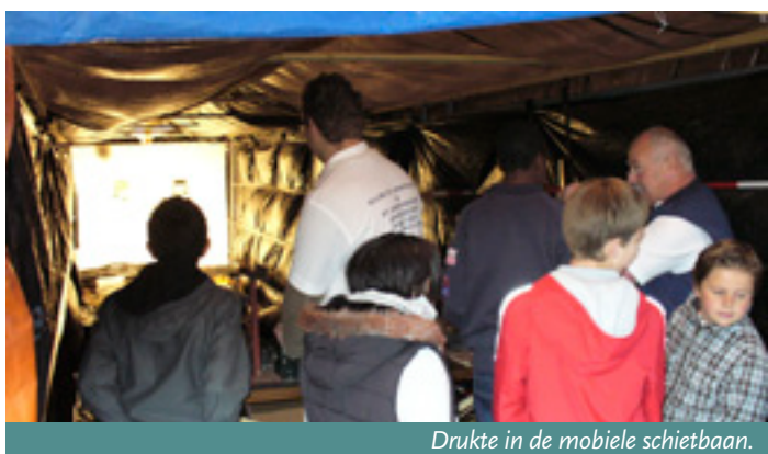
Drukte in de mobiele schietbaan.

Op Koninginnedag organiseerde het gilde Sint Crispinus & Sint Crispinianus van Besoijen tijdens de oranje festiviteiten van "vereniging Koninginnedagbesoijen" voor de derde keer de open luchtbukskampioenschappen van Besoijen. Door dit evenement kon het gilde zich op een mooie manier presenteren aan de jeugd en overige inwoners van de wijk Besoijen en de rest van Waalwijk. Het gilde is in het bezit van een zelfgemaakte mobiele tien-meter schietbaan met twee schietpunten welke de afgelopen drie jaar telkens weer gebruikt werd bij dit evenement. De bezoekers van de oranjefestiviteiten, en zeker de jeugd, maakten vele malen gebruik van de mogelijkheid om te schieten en zich te meten wie nu de beste schutter van Besoijen is. Ook werd op deze dag uitleg gegeven over wat het gilde nog meer in 'huis' heeft en werden geïnteresseerden uitgenodigd eens een keertje op het schietterrein te komen kijken. ■