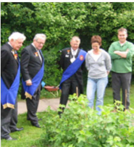
De deputatie van het gilde kreeg een rondleiding.

Een van de peilers waarop een gilde steunt is, dienstbaarheid aan de medemens. Het kolveniersgilde Sint Dionysius Tilburg zondert elk jaar een bedrag van de contributie af om daarmee een sociaal of cultureel doel financieel te ondersteunen. Dit jaar ging de bijdrage naar de stichting Zorgboerderij De Schelf tussen Alphen en Riel. De zorgboerderij biedt dagelijks aan ongeveer tien personen met een handicap de moge-