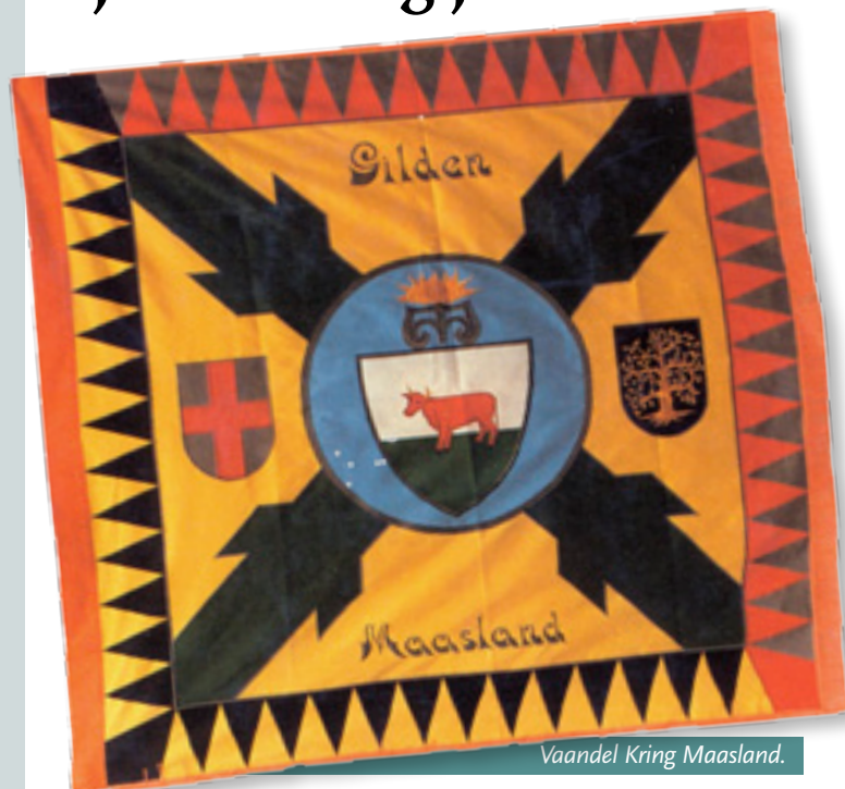
Vaandel Kring Maasland.

Op 9 maart 1935 werd in de Orangerie van kasteel Maurick te Vught de oprichtingsakte van de Bond van Schuttersgilden voor Maasland ondertekend. In 2010 viert zij haar vijfenzeventigjarig bestaan. Reden voor een feest. Bij een feest hoort ook een cadeau vond de SAT-commissie. Reeds in 2007 werden er plannen gesmeed voor het maken van een vervolg op het boek "Gilden Kring Maasland 1935 – 1985". Het boek moest alleen anders van opzet worden en toch wat van het oude hebben. De historie wilden we niet vertellen daar dit ruim beschreven werd in de vorige uitgave.