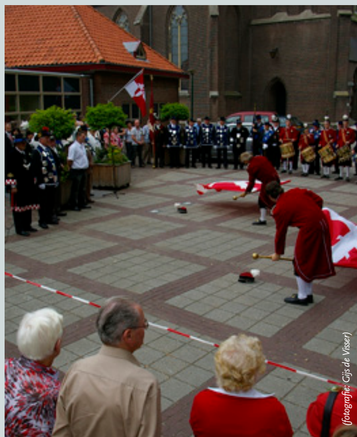
Vendelhulde aan de veteranen in Bernheze.