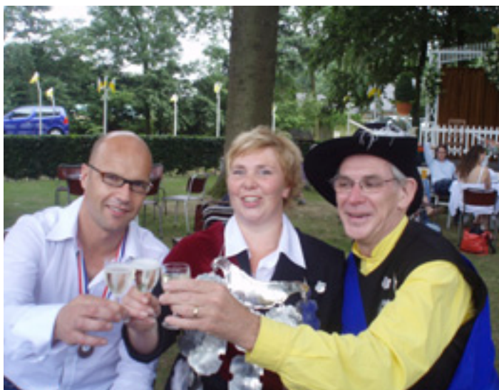
Een gezellig onderonsje op het Sint Jansfeest.