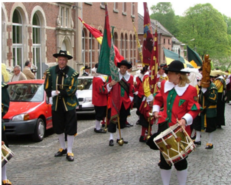
De gilden stellen zich op voor het onthaalcentrum 'de Pelgrim' voor de optocht door Scherpenheuvel.

Na de mis ging het terug naar de basiliek, waar de eed van trouw aan het kerkelijke