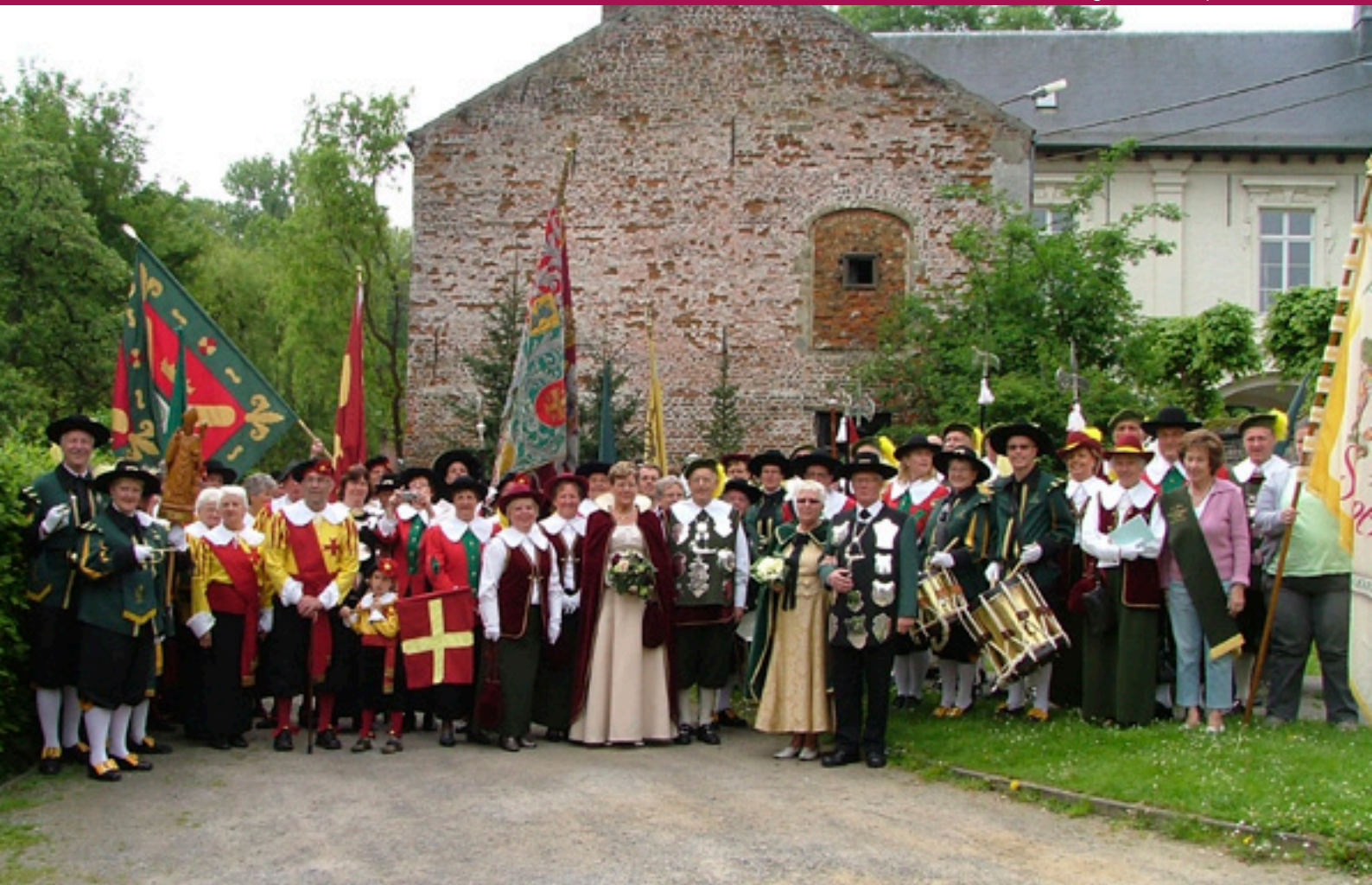
De vier Maaslandse gilden in Scherpenheuvel.