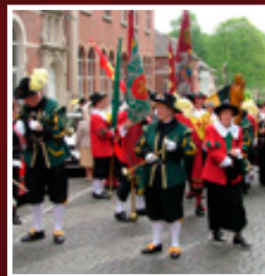
Pelgrimage naar Scherpenheuvel