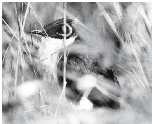
413-416 Jacobin Cuckoo / Jacobijnkoekoek Clamator jacobinus , Lehtimäki, Finland, 11 September 1976 (Jouni Mäkipelto)

Seychelles, in March and November-January (Skerrett et al 2006), highlighting the capacity of this species for non-stop over-water flights. In the Himalayas, vagrants have reached altitudes higher than 2600 m (Rasmussen & Anderton 2005). To the east, vagrants have occurred in Cambodia (Poole & Evans 2004) and Thailand, where there have been 15 records involving 19 individuals and the species may even be in the process of colonising the country (Phil Round in litt). More impressively, vagrants have reached the Ryukyu Islands, Japan, where one was videoed on Iriomote-shima on 1 June 1997 (Kamata 1997), and the Philippines, where one was recorded at Visita, Dalupiri, on 21 May 2004 (Allen et al 2006).