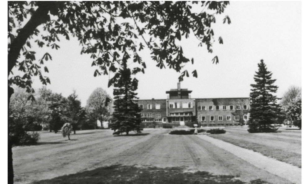
De achterzijde van het Mgr. Mutsaersoord voor de Tweede Wereldoorlog.

Venlo werd op 1 en 2 maart 1945 bevrijd, maar dat betekende nog geenszins, dat het bij het Mgr. Mutsaersoord, pal gelegen tegen het voormalige Duitse militaire vliegveld – het grootste van West-Europa – helemaal veilig was. De geallieerden streken neer op de overigens zwaar beschadigde Flietgerhorst. Toen het oorlogsgeweld definitief was geweken kon ook het bestuur van het Mutsaersoord de schade opmaken. Ontzetting, verbijstering, mogelijk woede over zoveel wat kapot was. Het Agnespaviljoen was opgeblazen en het hoofdgebouw was leeg geroofd en in een onherkenbare puinhoop veranderd. Bunkers en resten daarvan op het terrein, dat ook nog eens volledig was omgewoeld. Maar, welke emotie er ook speelde, wanhoop kreeg daar-