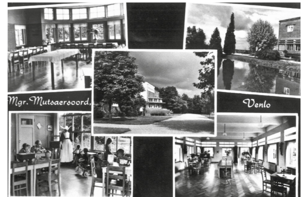
Bewoners en bezoekers konden met een Ansichtkaart van het Mgr. Mutsaersoord de groeten versturen.

bij geen plaats. Het herstellingsoord, beter gezegd, wat daar nog van over was, werd in oktober 1945 gedeeltelijk weer overgedragen aan de opnieuw opgerichte Rooms Katholieke Herstellingsoordvereniging Mgr. Mutsaers. In april 1948 volgde de rest.