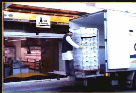
Con los establecimientos Área de Guissona, la CAG ha logrado cerrar el ciclo de producción completo.