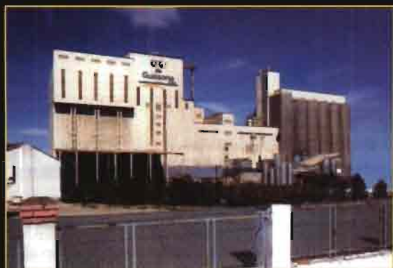
Agropecuaria de Guissona inicia su ciclo productivo desde sus cinco fábricas de piensos.

En el año 1962 se constituyó la Caja Rural de Guissona como entidad de ahorro