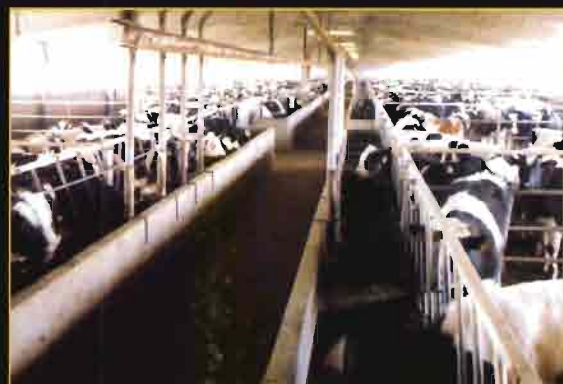
La cooperativa está presente en todos los subsectores ganaderos.