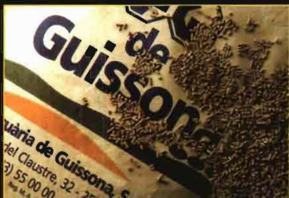
La producción de piensos de Guissona ascendió el pasado año a casi un millón de toneladas.