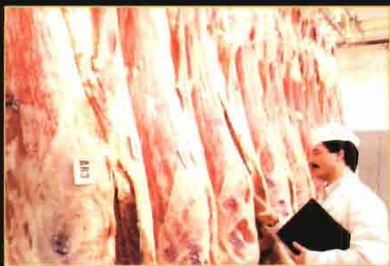
La CAG comercializó el pasado año 177.102 toneladas de productos animales.