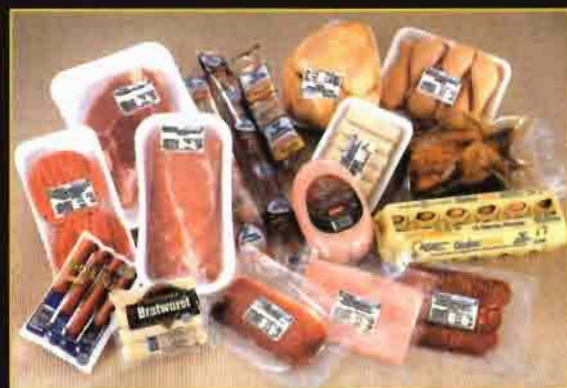
Agropecuaria de Guissona está entre las empresas que han conseguido la certificación ISO 9002.

de los socios y de apoyo financiero de la cooperativa, en 1964 se inicia la producción de pollos y cerdos, en 1970 comienza la comercialización de los productos cárnicos (en canal) con delegaciones propias y reparto, y en 1974 se inaugura la fábrica de elaborados cárnicos. De 1978 a 1990 es un período de expansión de la cooperativa, en 1990 se homologue los mataderos y en 1998 se obtiene la certificación de calidad ISO 9000 y se mejoran las instalaciones.