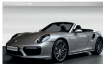
Porsche Zentrum Giessen www.porsche-giessen.de

Kraftstoffverbrauch (in l/100 km): innerorts 10,9 · außerorts 7,1 · kombiniert 8,5; CO 2 -Emissionen kombiniert 192 g/km · Effizienzklasse E