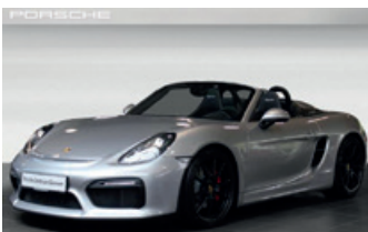
Porsche Zentrum Gießen www.porsche-giessen.de

309 kW (420 PS), EZ 04/16, 7.980 km, saphirblau-metallic, Lederausstattung inkl. Sitze Bi-Color graphitblau-creide, LED-Hauptscheinwerfer inkl. Porsche Dynamic Light System Plus (PDLS+), ParkAssistent vorne und hinten, BOSE® Surround Sound-System, 7-Gang Schaltgetriebe, Ablagenetz Beifahrerfußraum, Außenspiegel SportDesign, automatisch abblendende Innen-/Außenspiegel mit integriertem Regensensor, elektrisches Schiebe-/Hubdach aus Glas, Heckscheibenwischer, Licht-Design-Paket, Multifunktion und Lenkradheizung, Porsche Wappen auf Kopfstützen, Privacy-Verglasung (Fondseitenscheiben und Heckscheibe), Servolenkung Plus, Sitzbelüftung, Sitzheizung, Sportsitze Plus (4-Wege, elektrisch), Spurwechselassistent, Tempostat, Windschutzscheibe mit Graukeil, 20-Zoll Carrera Classic Rad u. v. m., EUR 125.760,-