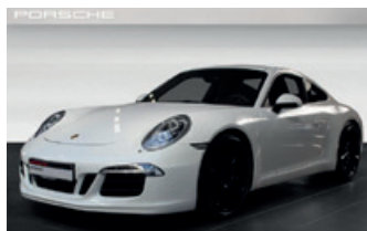
Porsche Zentrum Gießen www.porsche-giessen.de