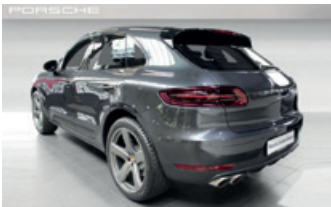
Porsche Zentrum Giessen www.porsche-giessen.de