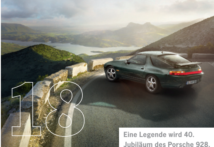
Eine Legende wird 40. Jubiläum des Porsche 928.