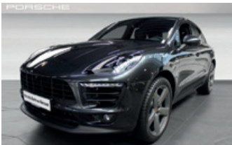
Porsche Zentrum Giessen www.porsche-giessen.de