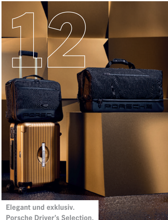
Elegant und exklusiv. Porsche Driver's Selection.