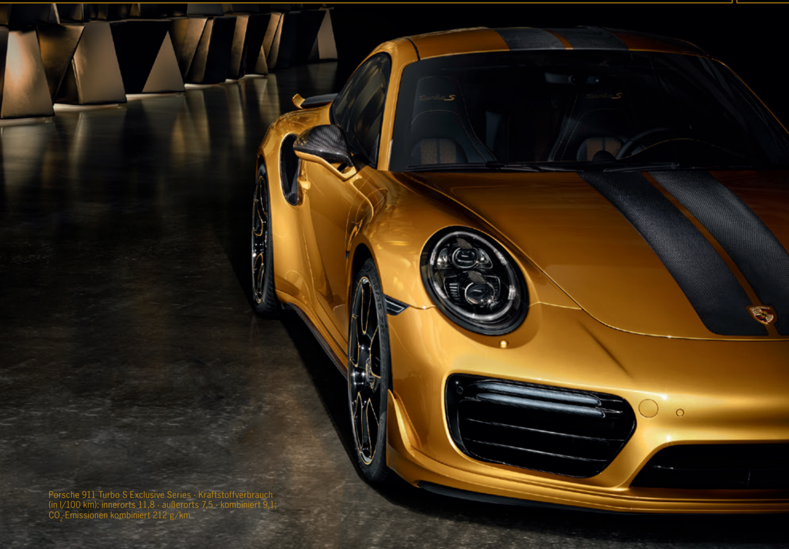
Porsche 911 Turbo S Exclusive Series · Kraftstoffverbrauch (in l/100 km): innerorts 11,8 · außerorts 7,5 · kombiniert 9,1; CO 2 -Emissionen kombiniert 212 g/km