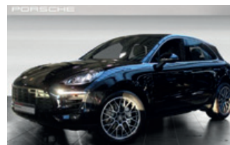
Porsche Zentrum Gießen www.porsche-giessen.de