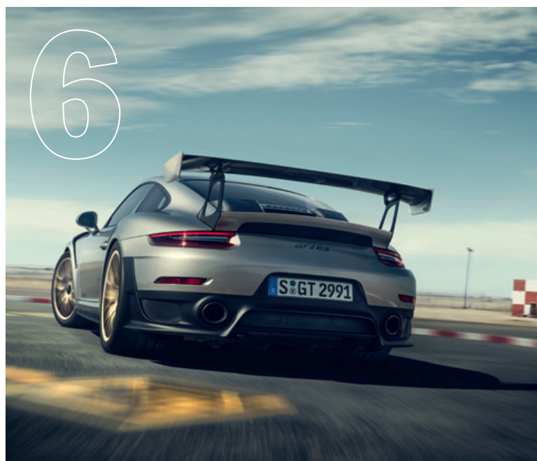
Lässt seinen Worten Taten folgen. Der neue 911 GT2 RS.

Porsche Times erscheint beim Porsche Zentrum Gießen, Sportwagen Scheller GmbH & Co. KG, Lahnwegsberg 2, 35435 Wetztenberg, Tel.: +49 641 98222-0, Fax: +49 641 98222-20, E-Mail: info@porsche-giessen.de , www.porsche-giessen.de ; Auflage: 1.916 Stück. Redaktionsanschrift: i.vent: Calwer Straße 19, 70173 Stuttgart, Tel.: +49 711 2172088-40. Für unverlangt eingesandte Fotos und Manuskripte wird keine Haftung übernommen. Die Verantwortung für die redaktionellen Inhalte und Bilder dieser Ausgabe übernimmt das Porsche Zentrum. Ausgenommen davon sind die offiziellen Seiten der Porsche Deutschland GmbH.