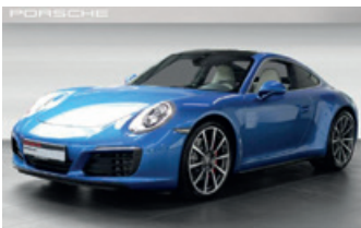
Porsche Zentrum Gießen www.porsche-giessen.de