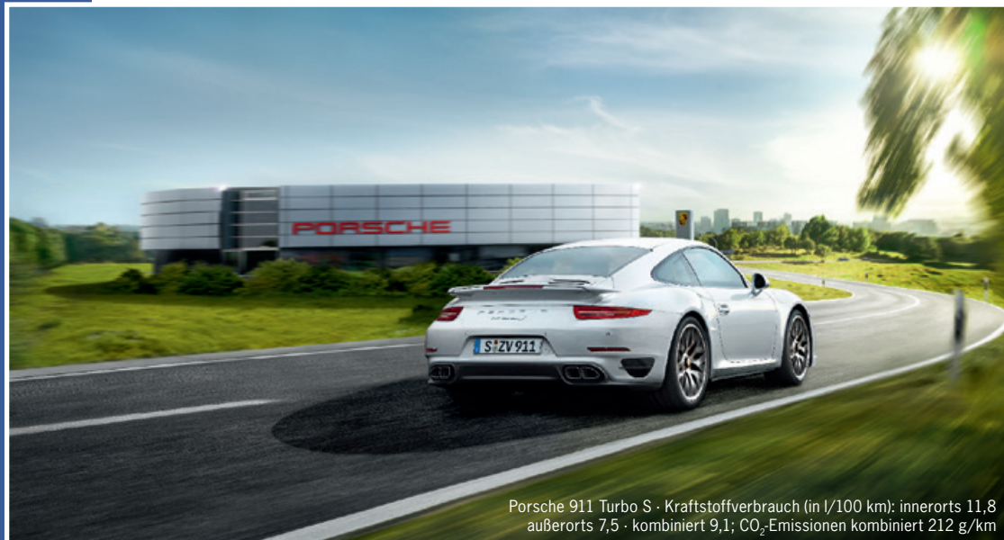
Porsche 911 Turbo S · Kraftstoffverbrauch (in l/100 km): innerorts 11,8 außerorts 7,5 · kombiniert 9,1; CO 2 -Emissionen kombiniert 212 g/km