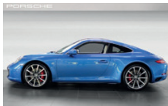
Porsche Zentrum Gießen www.porsche-giessen.de