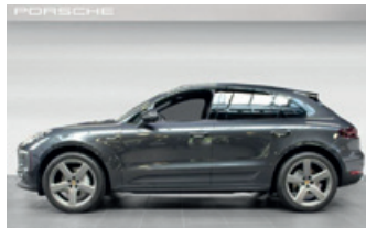
Porsche Zentrum Giessen www.porsche-giessen.de