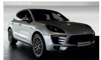
Porsche Zentrum Giessen www.porsche-giessen.de

Porsche 911 Turbo Cabriolet mit PDK , 397 kW (540 PS), EZ 02/17, 3.800 km, GT-silbermetallisch, Lederausstattung inkl. Sitze schwarz, LED-Hauptscheinwerfer schwarz inkl. Porsche Dynamic Light System Plus (PDLS+), adaptive Sportsitze Plus (18-Wege, elektrisch), Licht-Design-Paket, Porsche Wappen auf Kopfstützen, ISOFIX-Befestigung für Kindersitz auf Beifahrersitz, 20-Zoll 911 Turbo Rad u. v. m., MwSt. ausweisbar, EUR 179.870,-