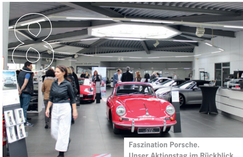
Faszination Porsche. Unser Aktionstag im Rückblick.