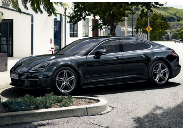
Der Traum vom Sportwagen. Ohne Kompromisse. Die neue Generation des Panamera.