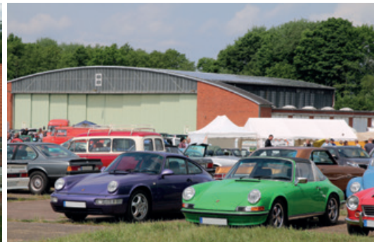
Mai 2016 – Classic Motor Days