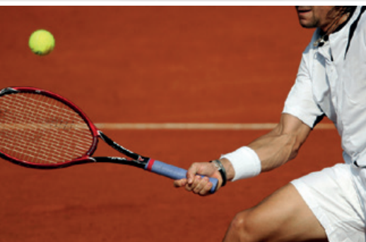
Mai 2016 – Alster Tennis