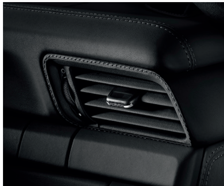
Lüftungsdüsen in Leder