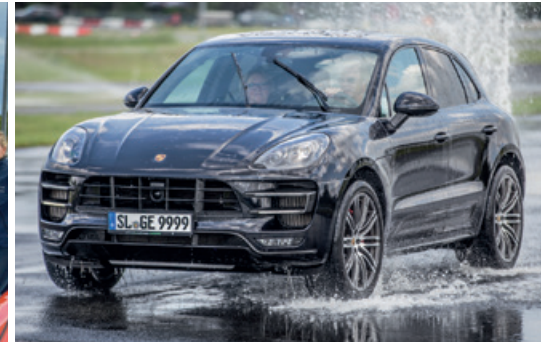
Mai 2016 – SUV-Fahrertraining