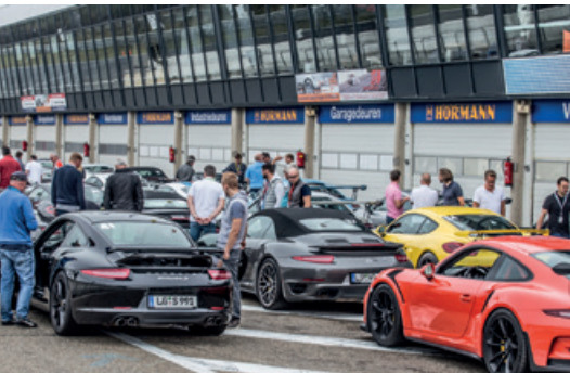
September 2016 – Sportfahrertraining Zandvoort