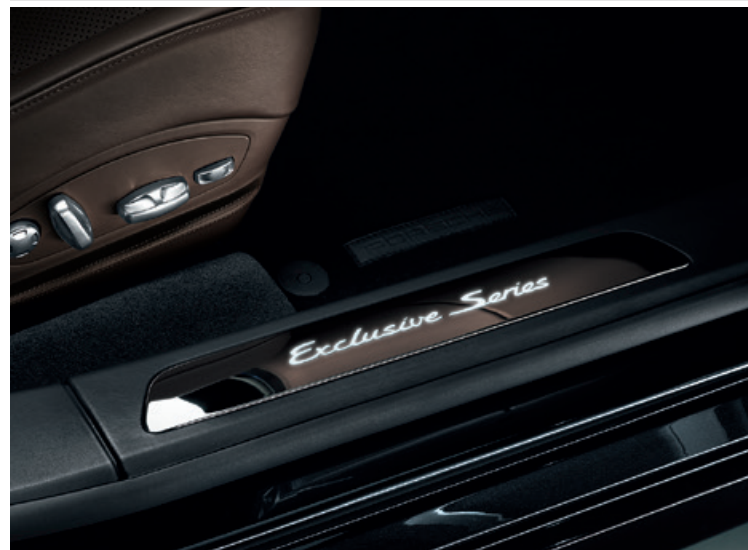
Türeinsteigsblenden frei individualisierbar