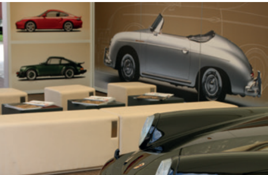
Juni 2016 – Oldtimermeile