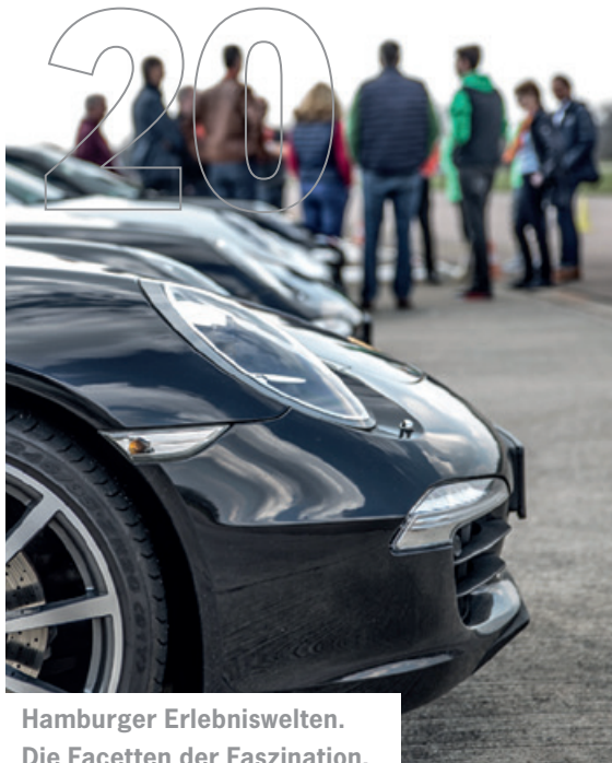
Hamburger Erlebniswelten. Die Facetten der Faszination.