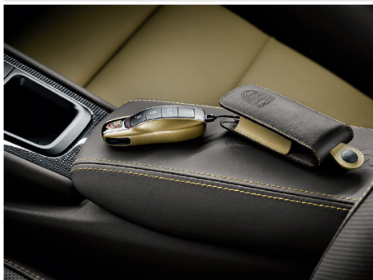
Fahrzeugschlüssel in Wagenfarbe