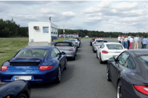
Juli 2016 – After Work Drive