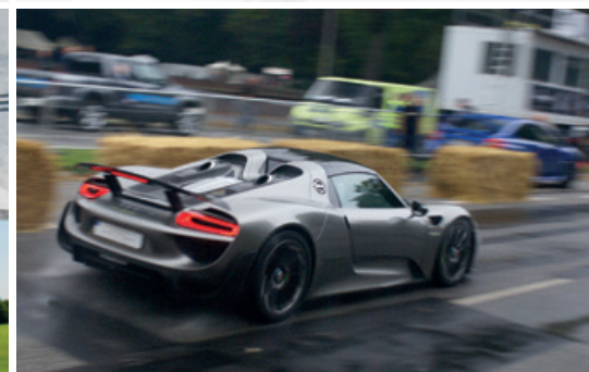
September 2016 – Stadtpark Revival