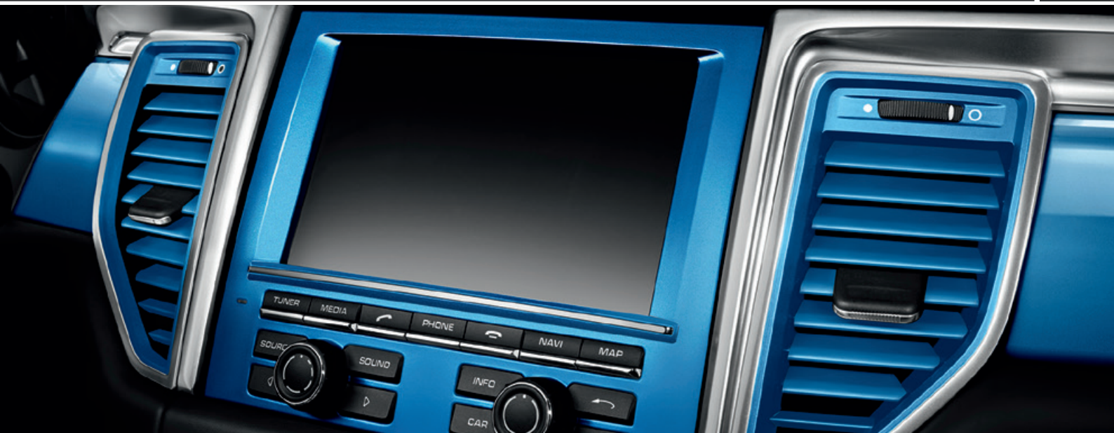
Elemente des Interieurs in Wagenfarbe