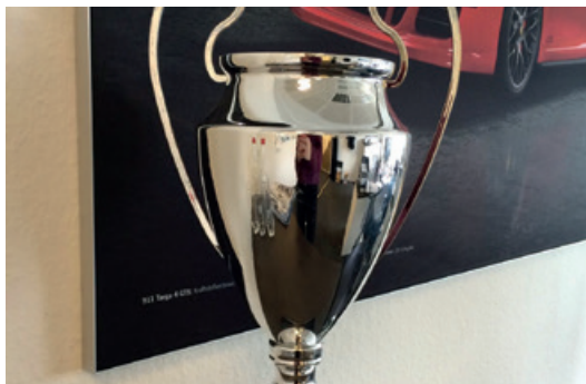
Juni 2016 – Porsche Golf Trophy