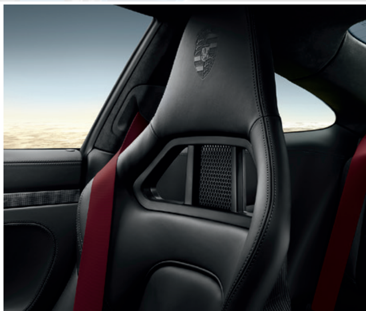
Sicherheitsgurte in Bordeauxrot