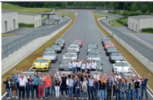
Juni 2016 – Sportfahrertraining Bilster Berg