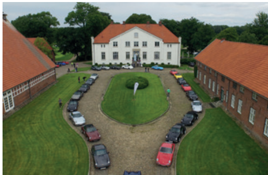
Juli 2016 – Aircooled Classic