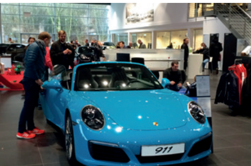
Januar 2016 – Neujahrsempfang