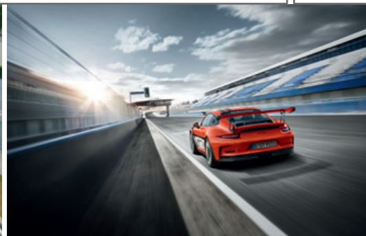
August 2016 – Porsche Sports Cup Experience