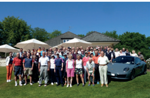
Mai 2016 – Golf Cup in Koop. mit Hapag-Lloyd Kreuzfahrten