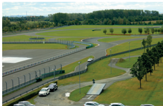
Juni 2016 – Fahrerlebnistag Leipzig 2016