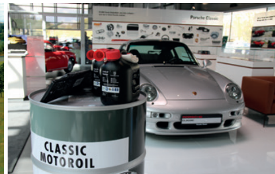
April 2016 – Porsche Classic Service Klinik