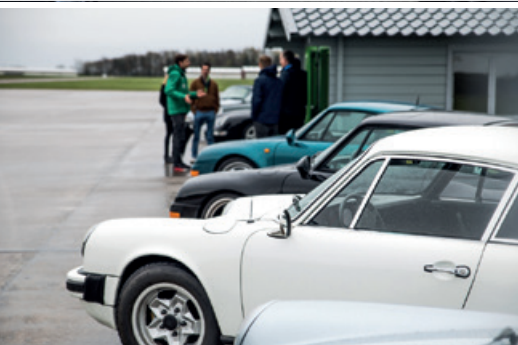
April 2016 – Classic Fahrertraining