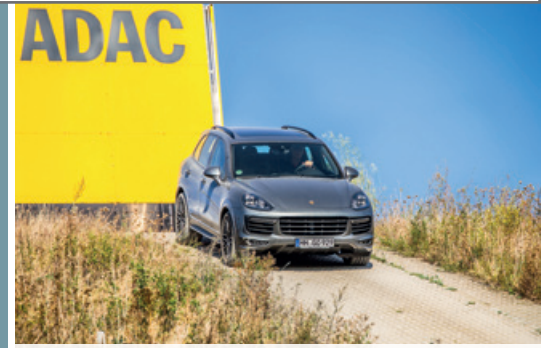
September 2016 – Fahrvent Tecis

Das Hamburger Porsche Jahr wurde 2016 mehr denn je von erlebnisreichen Fahr-events, faszinierenden Premieren, spannenden Sportveranstaltungen und vielen weiteren Events geprägt. Ganz besonders freuten wir uns darüber, unzählige neue Gesichter hier begrüßen zu dürfen. Genießen Sie mit diesem Mosaik ein weiteres Mal die Erlebnisse, Eindrücke und Emotionen eines unvergesslichen Jahres 2016.