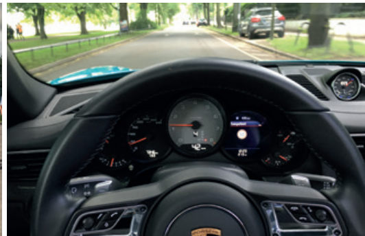
September 2016 – Connected Car