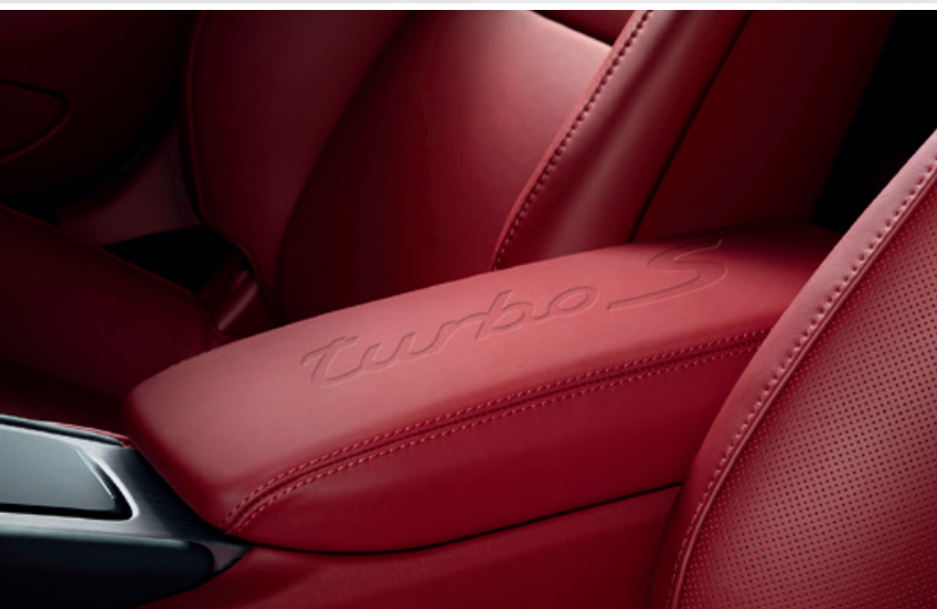
Modellprägung auf der Mittelarmlehne