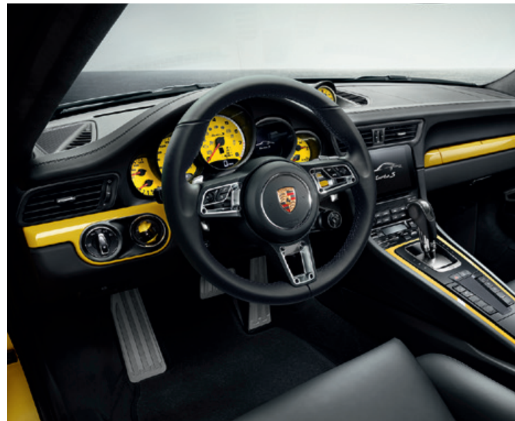
Interieur in Wagenfarbe

Durch das Porsche Exclusive Individualisierungsangebot lassen sich persönliche Freiheit und individueller Lebensstil wirkungsvoll ausdrücken. Unser Ziel: jedem Fahrzeug das gewisse Etwas zu geben, damit Ihr Traumwagen Wirklichkeit wird.