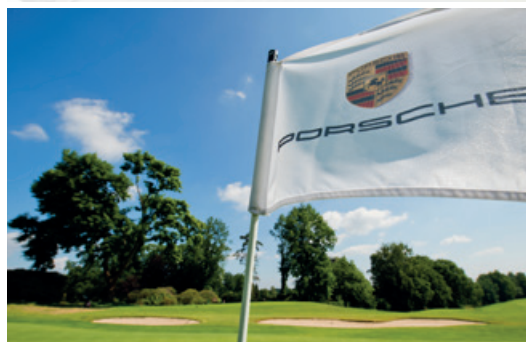
Juli 2016 – Porsche Golf Cup