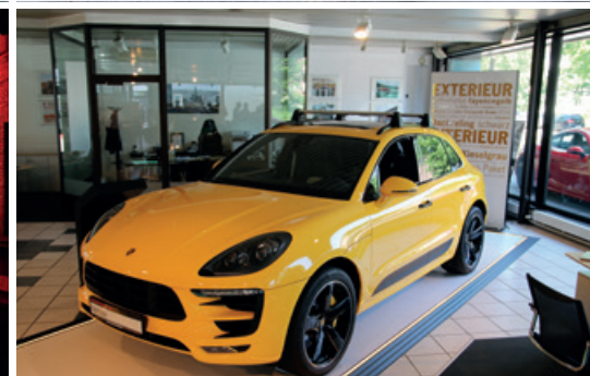
Juni 2016 – Porsche Exclusive & Equipment Aktionstag