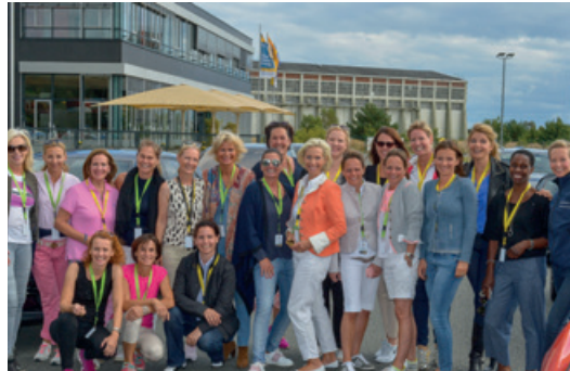
August 2016 – Fahrvent Club europäischer Unternehmerinnen