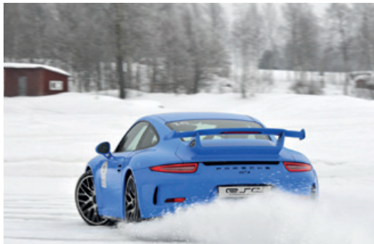
März 2016 – Wintertraining Schweden