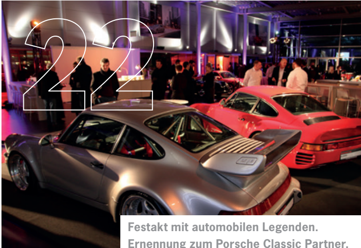
Festakt mit automobilen Legenden. Ernennung zum Porsche Classic Partner.