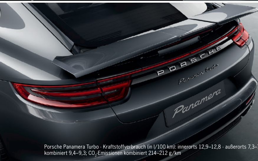
Porsche Panamera Turbo · Kraftstoffverbrauch (in l/100 km): innerorts 12,9–12,8 · außerorts 7,3–7,2 · kombiniert 9,4–9,3; CO 2 -Emissionen kombiniert 214–212 g/km