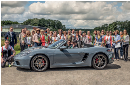
Juli 2016 – Ladies Day