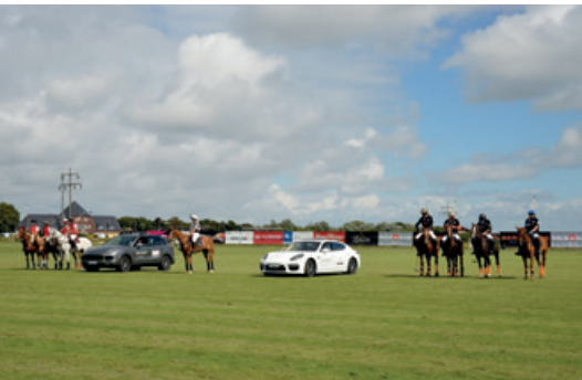
August 2016 – Berenberg German Polo-Masters