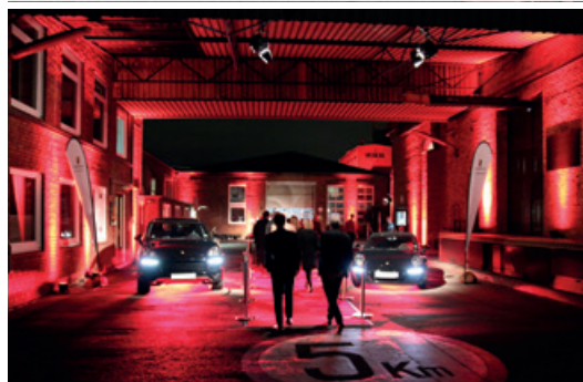
Oktober 2016 – Kundenevent Steinway & Sons