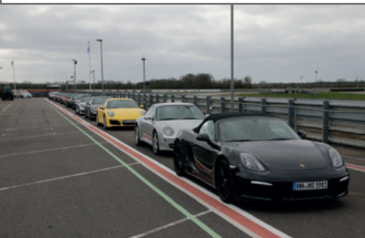
April 2016 – Sportfahrertraining Padborg