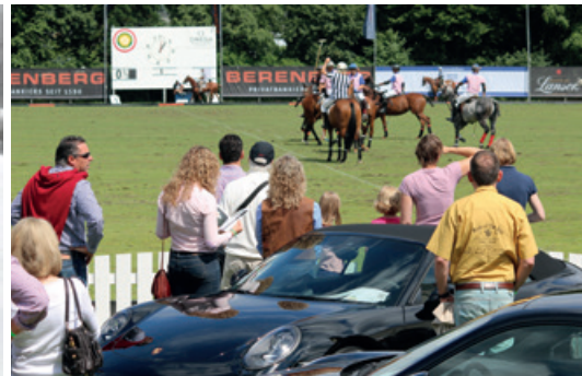
Juni 2016 – Berenberg Polo-Derby