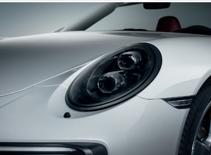
LED-Hauptscheinwerfer in Schwarz