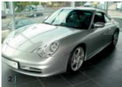
| 2 | 996 C2 Coupé, arctissilber-met., Leder schwarz, EZ 10/03, 12.300 km Euro 69.500,-*