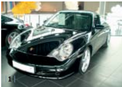
| 1 | 996 C2 Coupé, schwarz, Leder schwarz, EZ 01/02, 80.400 km Euro 52.700,-*

Das komplette und tagesaktuelle Fahrzeugangebot finden Sie auf unserer Internetseite: www.pz-hofheim.de