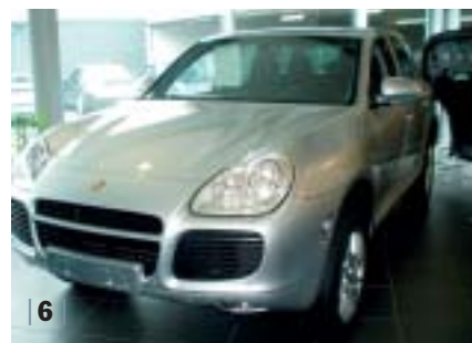
| 6 | Cayenne Turbo, kristallsilber-met., Leder schwarz, EZ 04/03, 49.000 km Euro 77.900,-*