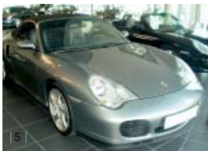
| 5 | 996 Turbo Cabrio, sealgrau-met., Leder metropolblau, EZ 07/03, 25.300 km Euro 106.900,-*