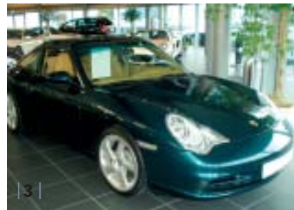
| 3 | 996 Targa, lagogrün-met., Leder savannabeige, EZ 02/03, 8.700 km Euro 68.900,-*