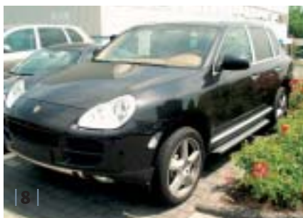
| 8 | Cayenne S, basaltschwarz-met., Teilleder havanna-sandbeige, EZ 04/03, 46.500 km Euro 59.900,-*