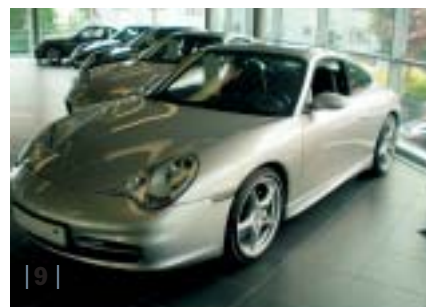
| 9 | 996 C2 Coupé, arctissilber-met., Leder schwarz, EZ 01/03, 25.400 km Euro 61.600,-*