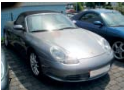
| 7 | 986 Boxster S, sealgrau-met., Leder graffitigray, EZ 01/04, 24.000 km Euro 39.500,-*