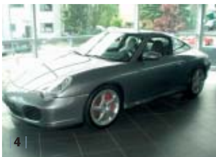
| 4 | 996 4S Coupé, sealgrau-met., Leder schwarz, EZ 07/03, 20.000 km Euro 74.900,-*