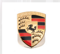
Teile-Nr. 64455921002 EUR 61,-*

Typisch für diese beiden Porsche Wappen: das auffällige Rotorange. Für den „PORSCHE“ Schriftzug in der Grundfarbe Gold werden breite Buchstaben verwendet, „Stuttgart“ steht erhaben auf vertieftem Hintergrund. Das kräftige Pferd besitzt ein markantes Schultergelenk und einen vollen Schweif.