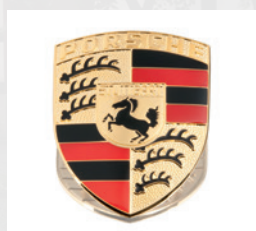
Teile-Nr. 90155921027 EUR 145,-*