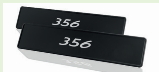
Teile-Nr. PCG70135600 EUR 36,-*

Schwarzes Kennzeichenschild mit weißem „356“ Aufdruck in den Maßen 11x52cm; verwendbar für Porsche 356 der Modelljahre 1950–1965.**