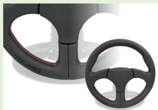
Teile-Nr. 000043161158YR EUR 654,-*

Beinahe selbst schon ein Klassiker: das 3-Speichen-Sportlenkrad in schwarzem Leder mit geprägtem Wappen und roter Ziernaht. Verwendbar für 911 (1974–1989) und 959 (1987–1988).**