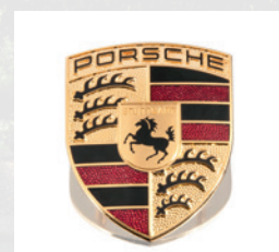
Teile-Nr. 99655921101 EUR 103,-*

Schlanke Buchstaben in Schwarz charakterisieren den „PORSCHE“ Schriftzug. „Stuttgart“ wird vertieft integriert. Die Farbe im Porsche Wappen ist rottransparent.