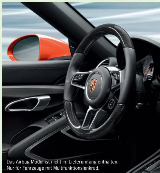
Das Airbag-Modul ist nicht im Lieferumfang enthalten. Nur für Fahrzeuge mit Multifunktionslenkrad.

Komplettpreis inkl. Einbau ab EUR 969,-*