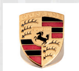
Teile-Nr. 90155921026 EUR 95,-*

Der „PORSCHE“ Schriftzug strahlt in der Farbe Gold. „Stuttgart“ steht erhaben auf vertieftem Hintergrund. Die Farbe im Porsche Wappen leuchtet rottransparent.