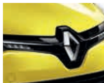
JAUNE ÉCLAIR (OPAQUE)