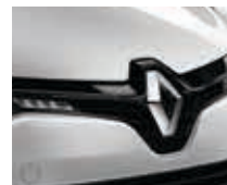
GRIS PLATINE (MÉTAL)