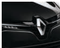
NOIR ÉTOILE (MÉTAL)