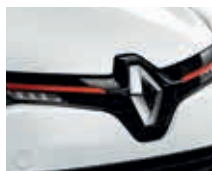
BLANC GLACIER (OPAQUE)