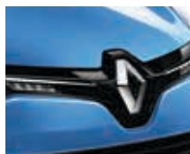
BLEU DE FRANCE (OPAQUE)