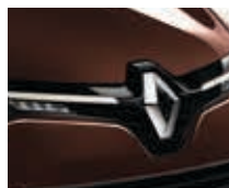
BRUN ARDENT (MÉTAL)