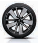
Jantes 17" Drenalic Noir Niveau Intense