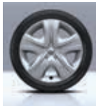
Roue 16" Flexwheel Niveau Passion