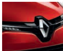
ROUGE FLAMME (MÉTAL)