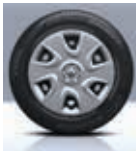
Enjoliveur 15" Niveau Emotion