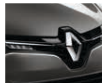
GRIS CASSIOPÉE (MÉTAL)