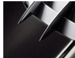
002 Cassiterit schwarz/ cassiterite black