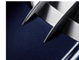
502 Digenit blau /digenite blue