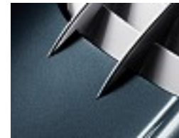
501 Amazonit blau /amazonite blue