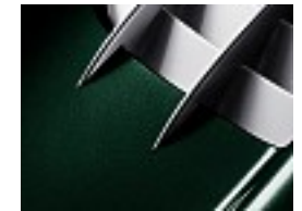
601 Fayalit grün /fayalite green