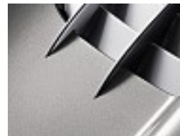
701 Antimon grau /antimony grey