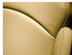
L05 Pastellgelb/pastel yellow