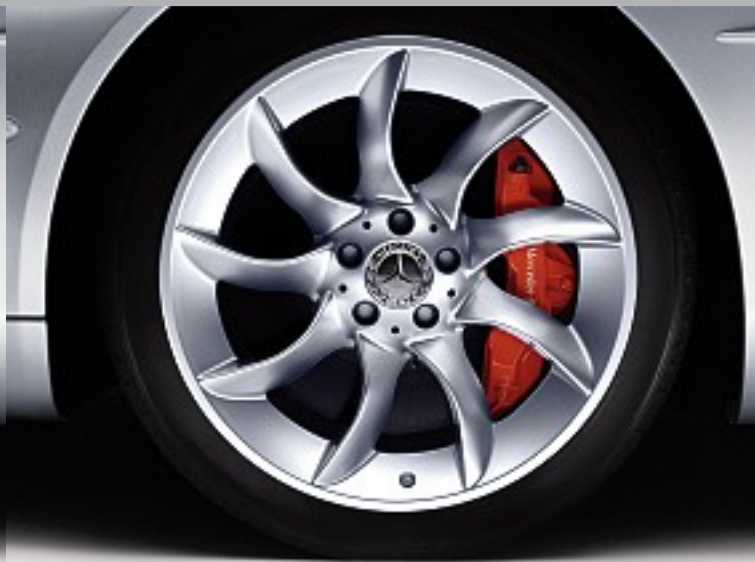
19-Zoll-Leichtmetallräder im asymmetrischen Turbinendesign. Bremssättel in Rot lackiert. 19-inch light-alloy wheels with asymmetrical turbine design. Brake callipers painted red.