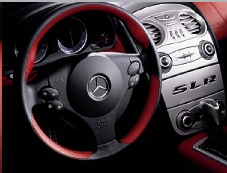
Lenkrad zweifarbig am Beispiel von 300 SL rot. Two-tone steering wheel, with 300 SL red as an example.