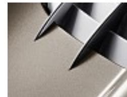
704 Coronadit grau /coronadite grey