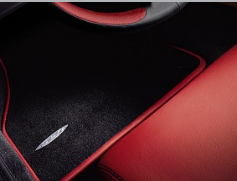
Ledereinfassung Fußmatten in zweiter Ausstattungsfarbe am Beispiel von 300 SL rot. Leather edging for floor mats in second appointments colour, with 300 SL red as an example.