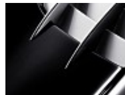
901 Schwarz /black

Pure Lack, ohne Mehrpreis/ Pure paint finish, at no extra charge