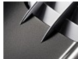
703 Osmium grau /osmium grey