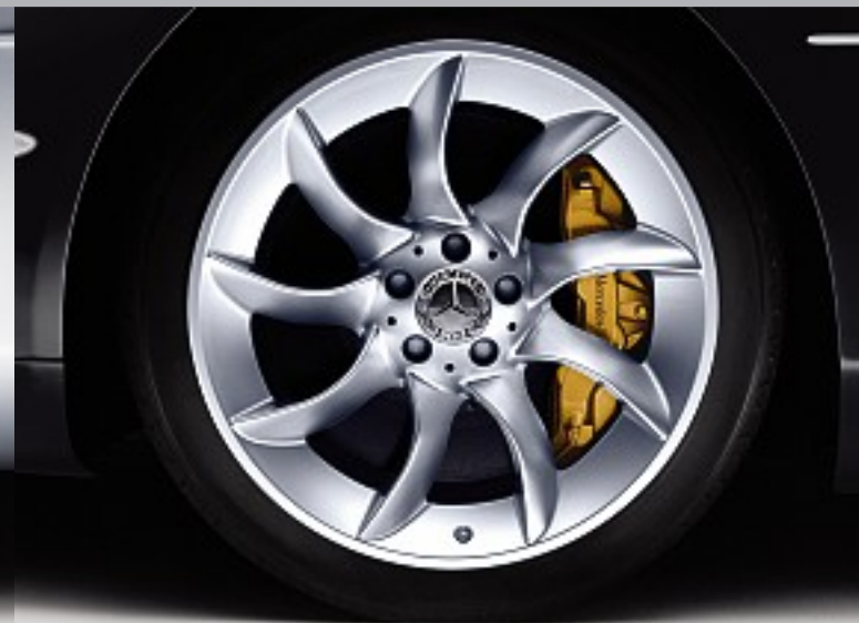
19-Zoll-Leichtmetallräder im asymmetrischen Turbinendesign. Bremssättel in Gold lackiert. 19-inch light-alloy wheels with asymmetrical turbine design. Brake callipers painted gold.