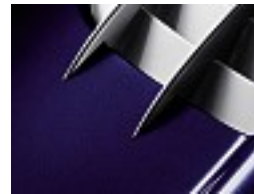
001 Covellin blau /covelline blue

Crystal Lacke, ohne Mehrpreis/ Crystal paint finishes, at no extra charge