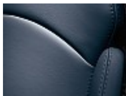
L18 Pazifikblau dunkel/ dark pacific blue