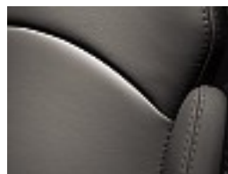
L04 Graphitgrün/graphite green