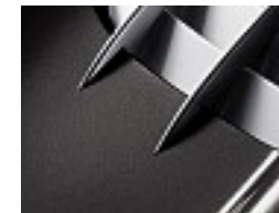
710 Palladium grau /palladium grey