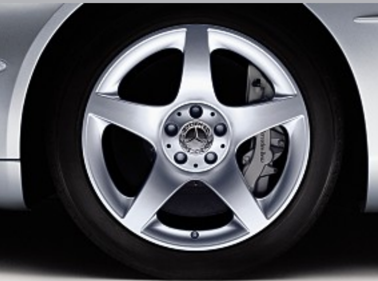
18-Zoll-Leichtmetallräder im 5-Speichen-Design, ohne Mehrpreis. 5-spoke 18-inch light-alloy wheels, at no extra charge.