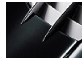
903 Picotit schwarz /picotite black

Pure Lack, ohne Mehrpreis/ Pure paint finish, at no extra charge