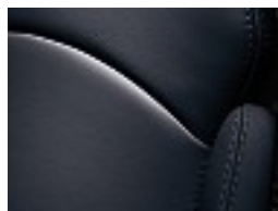
L20 Royalblau/royal blue